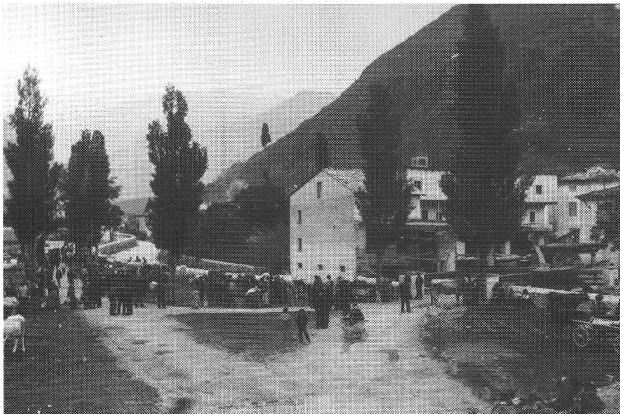
Mercato al ponte di S. Bartolomeo, Poschiavo 1885