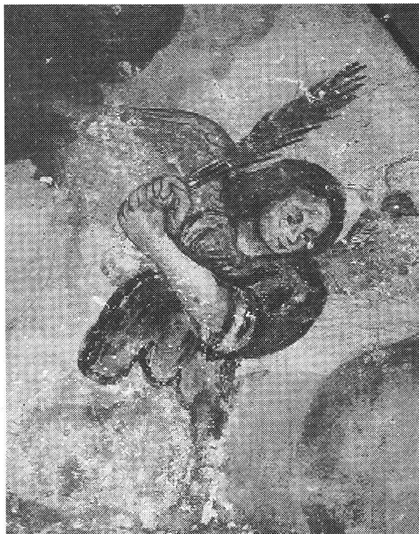
Angelo del giudizio universale, Ossario di Cauco

L'ossario di Cauco merita di essere conosciuto e apprezzato per gli affreschi di Johann Jakob Rieg da Somvico (Sumvitg) che si va scoprendo sempre più come un vero maestro nel suo genere, primitivo per certe carenze tecniche, ma insuperabile nell'impasto dei colori, l'ingenua poesia e