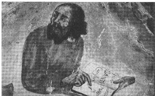
L'Evangelista S. Marco