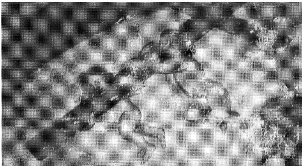
Angeli della parusia di Cristo

l'espressione della fede popolare. Le sue opere, oltre che in Calanca, si incontrano un po' dappertutto nella valle del Reno anteriore, a Truns, Obersaxen, Dardin, ecc., e anche in Val di Blenio e a Isola Madesimo nel Chiavennasco. Considerato nel contesto della rivalutazione delle opere del Rieg attualmente in atto, il restauro dell'ossario di Cauco si rivela un'operazione di altissimo valore culturale.