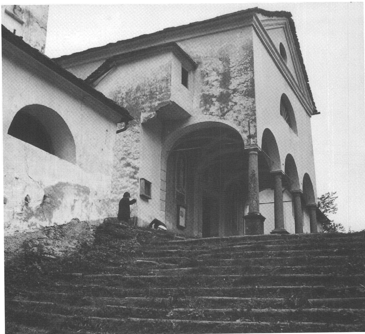
Chiesa di S. Bernardo a Rossa