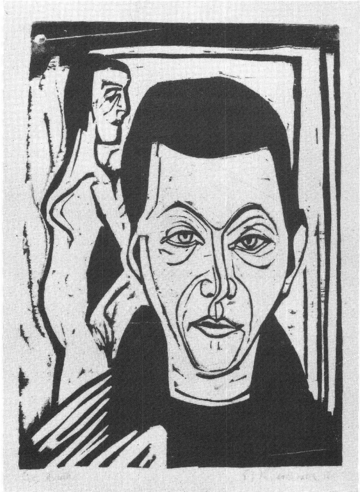
E.L. Kirchner, Autoritratto, xilografia 1926, 32,4 x 23,4 cm su 39 x 30 cm

tarietà e giammai di concorrenzialità con altri musei, primo fra tutti quello di Coira, con il nobile fine di lumeggiare fino nei minimi particolari l'opera di questo grande «davosiano» di adozione.