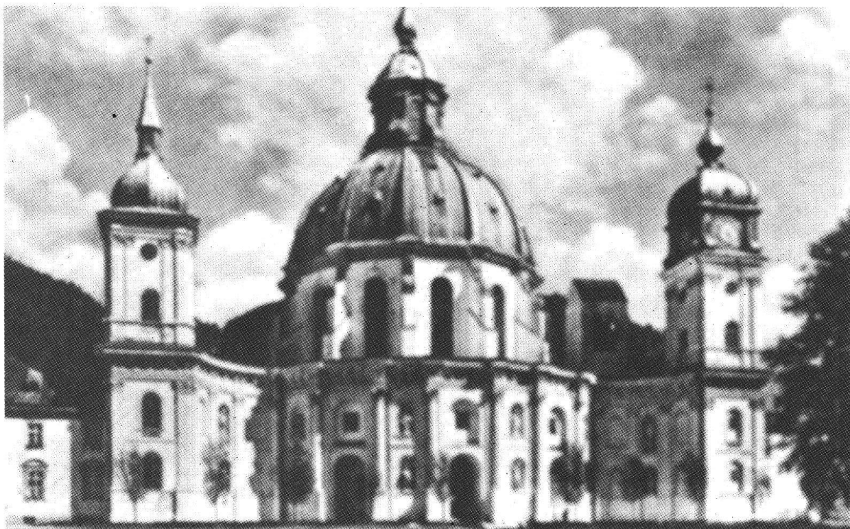
E. Zuccalli: chiesa conventuale di Ettal, 1711 (A. Reinle, Unsere Kunstdenkmäler XXIV, 1973, n. 4, p. 233)