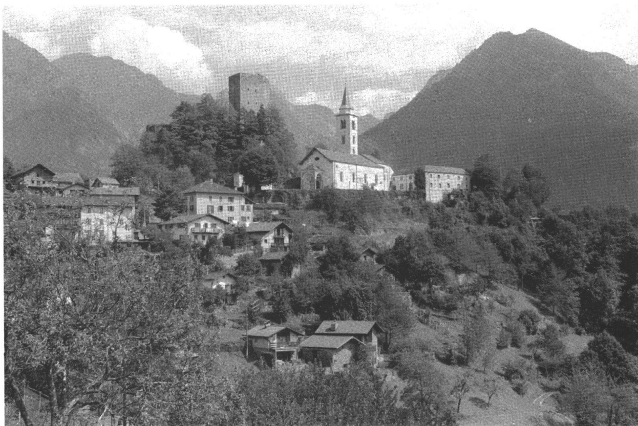
Chiesa parrocchiale dedicata a Maria Assunta + torre