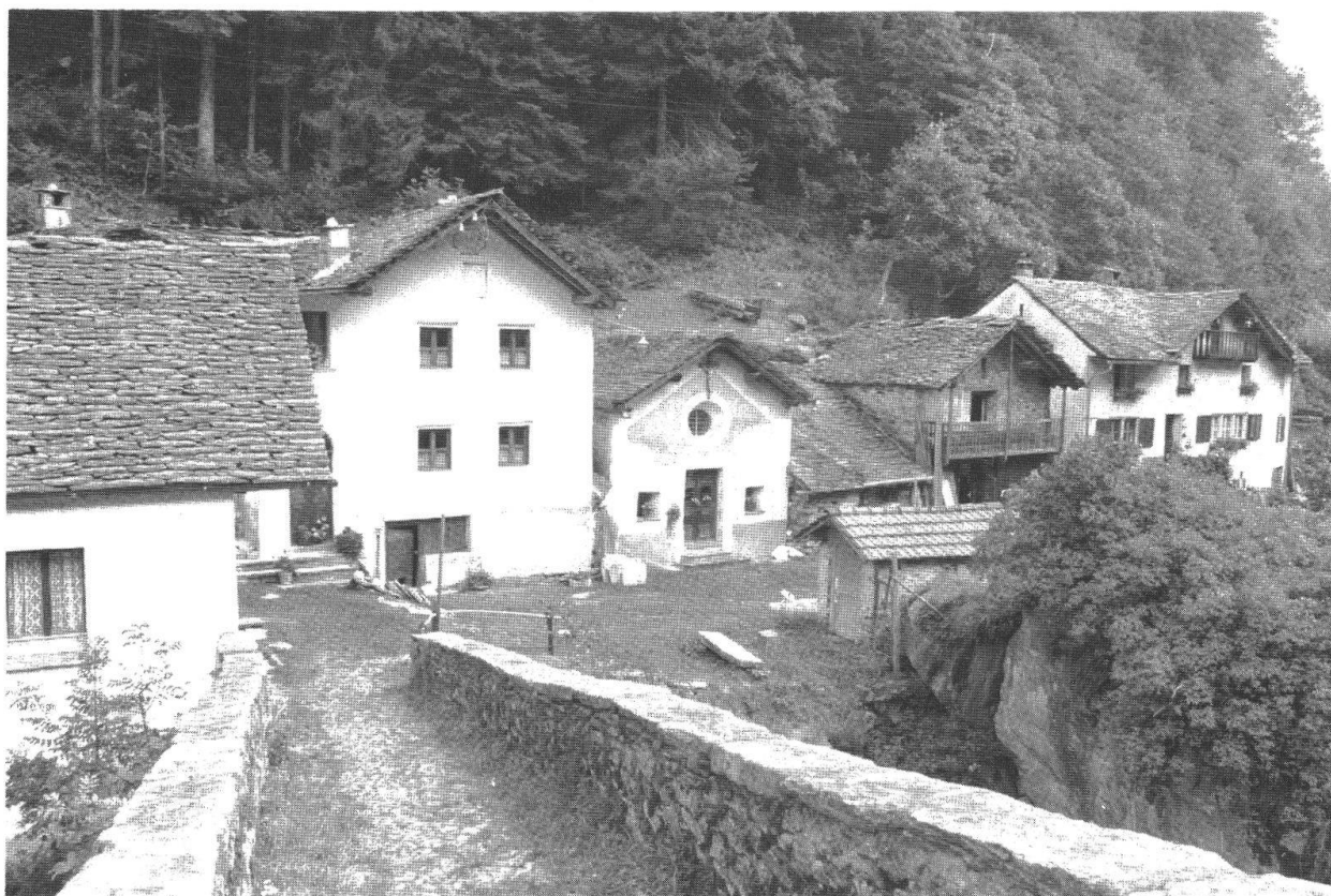
Cappella S. Giovanni Nepomuceno (vista dal ponte)

Sulla sinistra della Calancasca, presso il ponte per Braggio. Dell'inizio del Settecento. Restaurata all'esterno alcuni decenni fa. Stucchi a forma di conchiglia alle due finestre esterne.