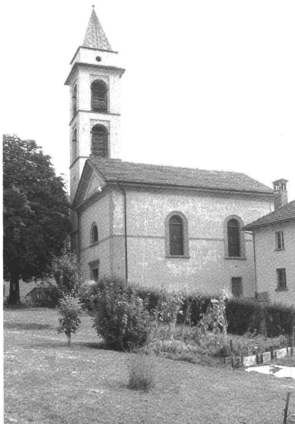
Chiesa parrocchiale di Santo Stefano

presenta Cristo (il Salvatore) con alla destra Santo Stefano, in abiti di diacono, e alla sinistra l'apostolo S. Mattia. Sull'altare un tabernacolo in legno, in forma di tempio a due piani, con colonne tortili e molte statuette. Barocco, della seconda metà del Seicento.