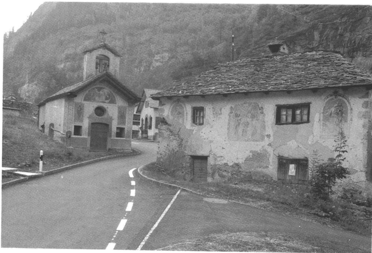
Cappella Madonna di Loreto

Su alcune case di Bodio e di Cauco affreschi settecenteschi , restaurati una trentina di anni fa. Uno, ancora conservato ma molto compromesso dalla trasformazione della stalla Contini in casa di vacanza, si trova subito sopra la cappella, a destra della strada: rappresenta la Madonna, con ai lati i Santi Filippo Neri e Giovanni Nepomuceno; un altro, sulla casa Bertossa n. 18 la Madonna con S. Pietro e S. Giuseppe; a Cauco, sulla casa Rampini, n. 19: la Madonna di Re con il Bambino.