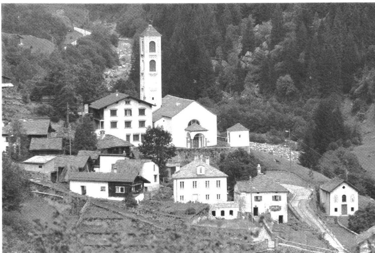
Chiesa parrocchiale di San Lorenzo

sivo della vittoria delle galere cristiane sulle imbarcazioni musulmane. In alto la Madonna del Rosario, cui fu attribuito il felice esito dello scontro; a sinistra le bandiere del Papa, di Spagna, dell'Ordine di Malta e di Venezia. In basso il Papa Pio V fra Filippo II di Spagna e il Doge Mocenigo. A destra la sconfitta delle navi turche, 1649.