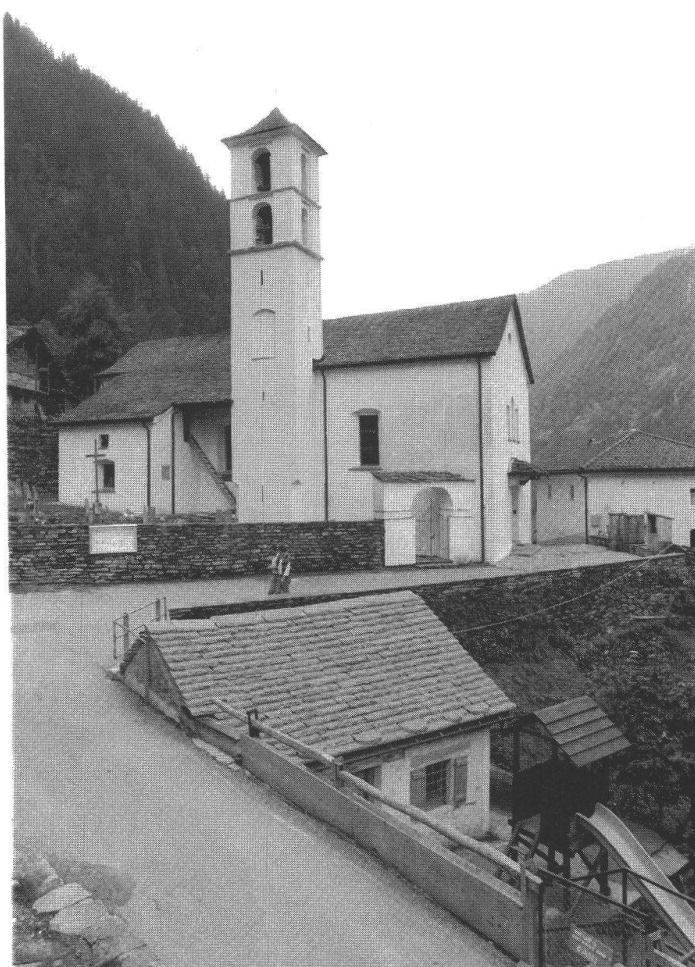
Chiesa parrocchiale dei Santi Giacomo e Pietro