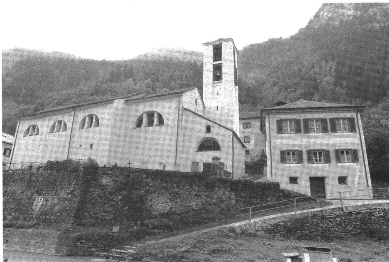
Chiesa parrocchiale di Santa Domenica