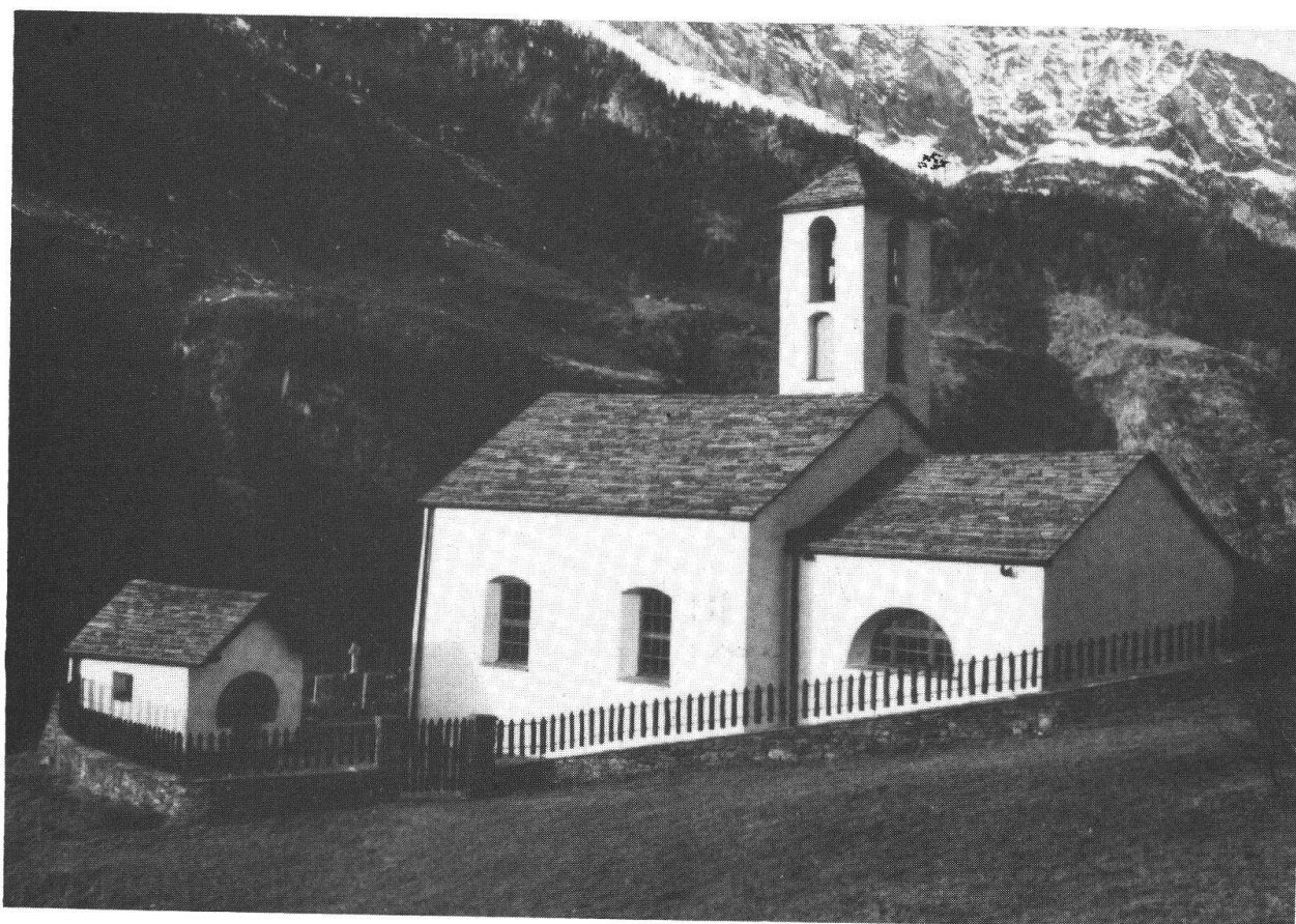
Chiesa parrocchiale di S. Bartolomeo

cappella fu consacrata nel 1633 in onore di San Bartolomeo e Sant'Anna. Nel 1687 si decide di costruire una chiesa nuova in località chiamata Pezza , sopra l'attuale stazione della funivia. Ma i contrari continuano a portare acqua nello scavo per le fondamenta, per dimostrare che il luogo scelto è troppo umido. Quattro anni dopo, il 2 aprile 1691, il canonico e vicario Tini, manda una sentenza del Vescovo di Coira, perché si solleciti la preparazione dei materiali e si ordini alla gente del posto di presentarsi per il lavoro in comune, sotto pena di soldi trenta al giorno, da destinare «a beneficio della fabbrica». Ma