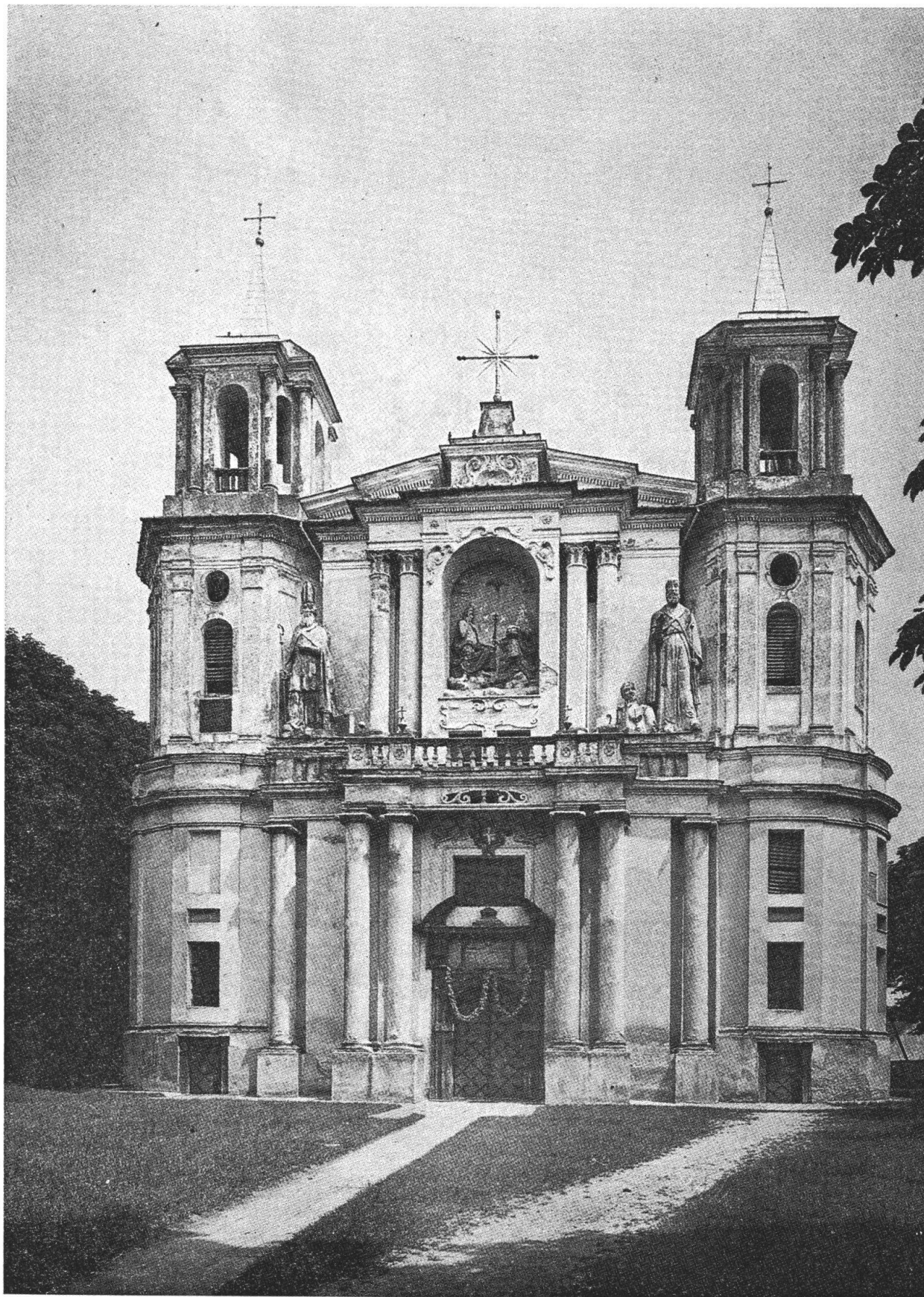
Tarlow, Chiesa parrocchiale, 1647 - 1655, facciata