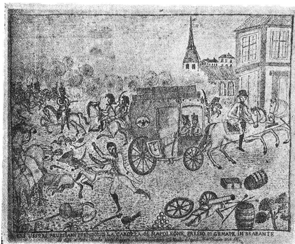
Disegno di G. A. Maurizio

inglesi, il generale Wellington comandava questi ed il general Blucher comandava li prussiani, ma ambi di comune accordo nelle loro operazioni militari. Napoleone marciò verso loro con grandissimo esercito coll'intenzione di battere questi due sopradetti generali prima che arrivassero li russi ed austriaci ed altri che erano a favore dei francesi come se l'avrebbero creduto come qui sotto dirò.