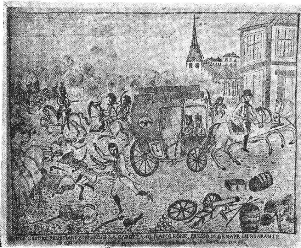
Disegno di G. A. Maurizio

inglesi, il generale Wellington comandava questi ed il general Blucher comandava li prussiani, ma ambi di comune accordo nelle loro operazioni militari. Napoleone marciò verso loro con grandissimo esercito coll'intenzione di battere questi due sopradetti generali prima che arrivassero li russi ed austriaci ed altri che erano a favore dei francesi come se l'avrebbero creduto come qui sotto dirò.