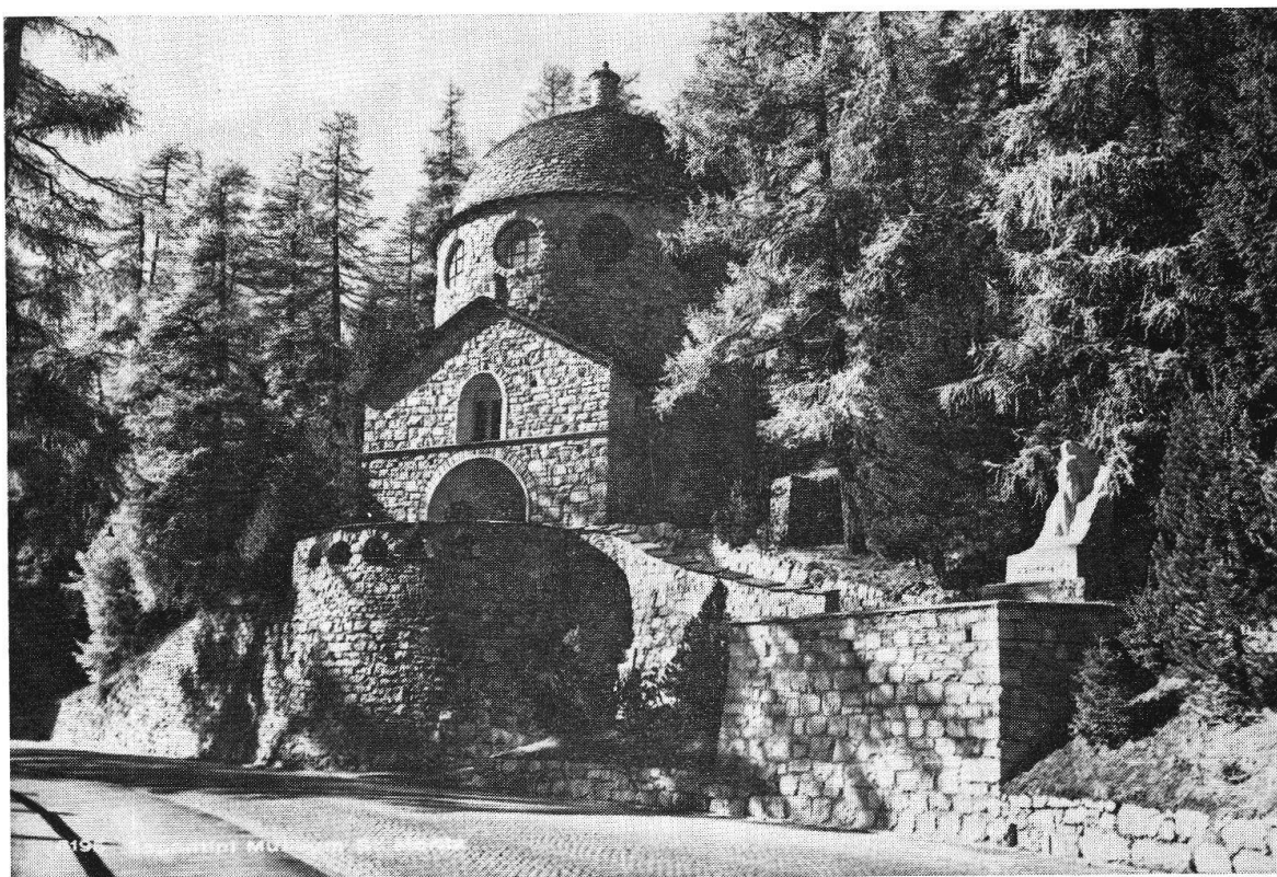
Il Museo Segantini prima dell'ampliamento. Il nuovo edificio è stato aggiunto dietro, sul pendio boscoso.