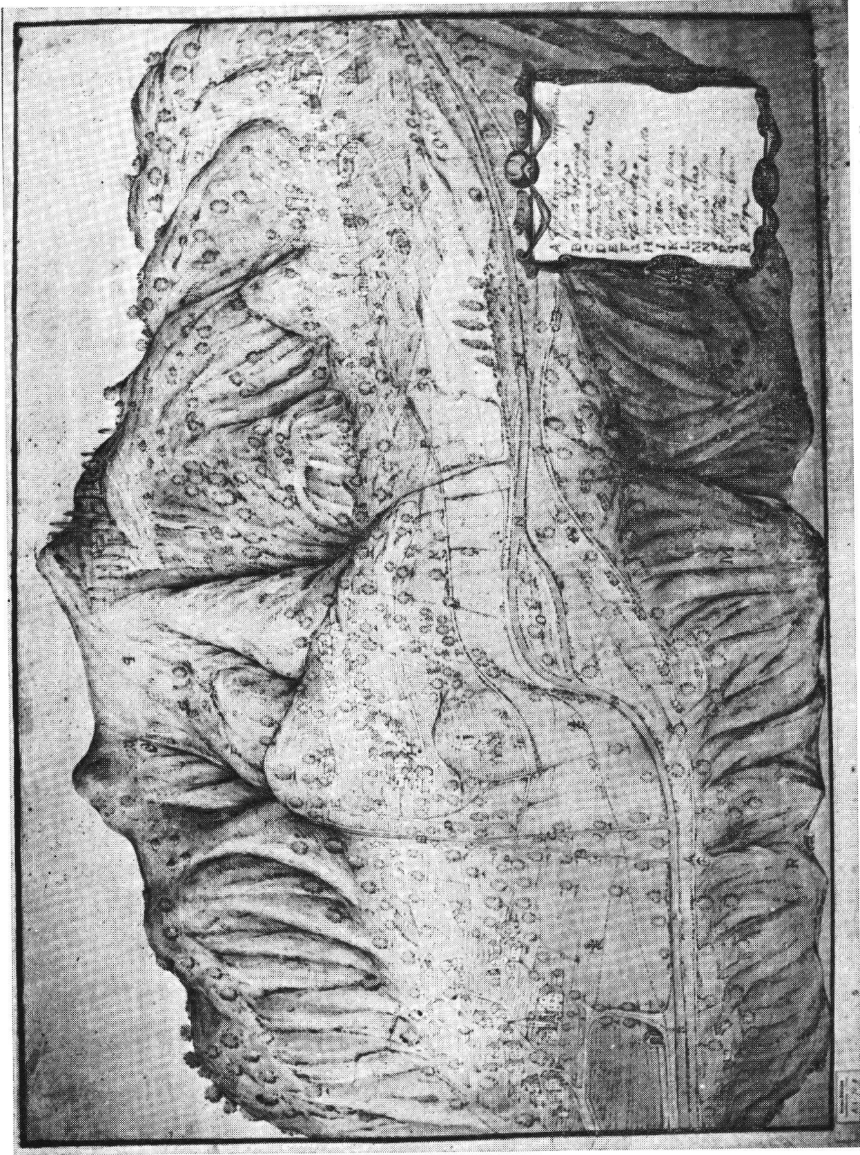
Il disegno acquarellato del 1776: a destra S. Vittore con la Collegiata e le case principali