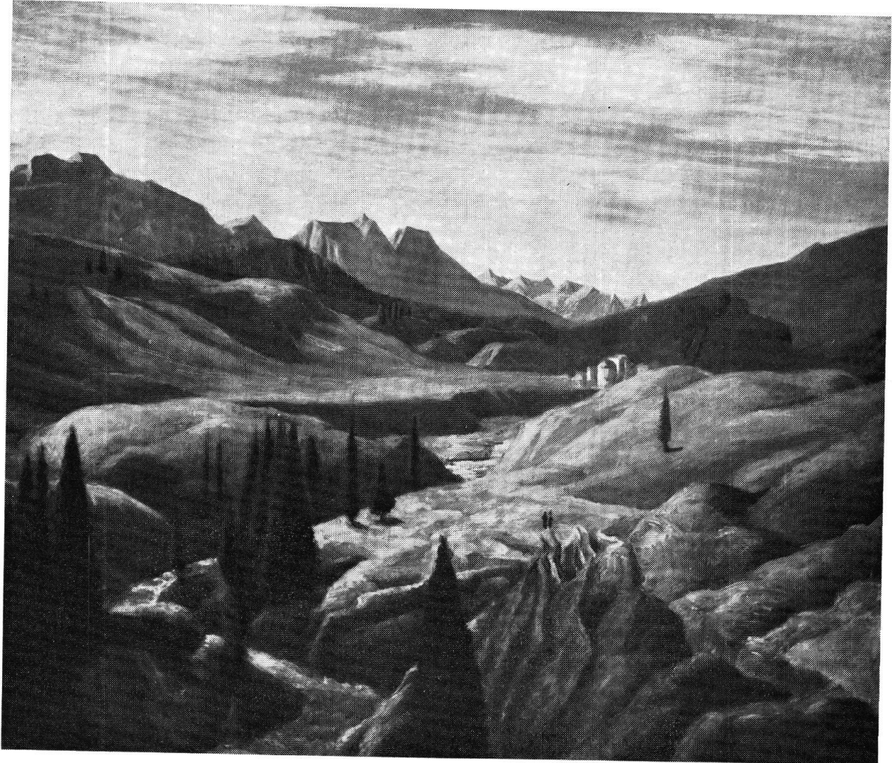
Viktor Surbek: San Bernardino , olio su legno, 1927