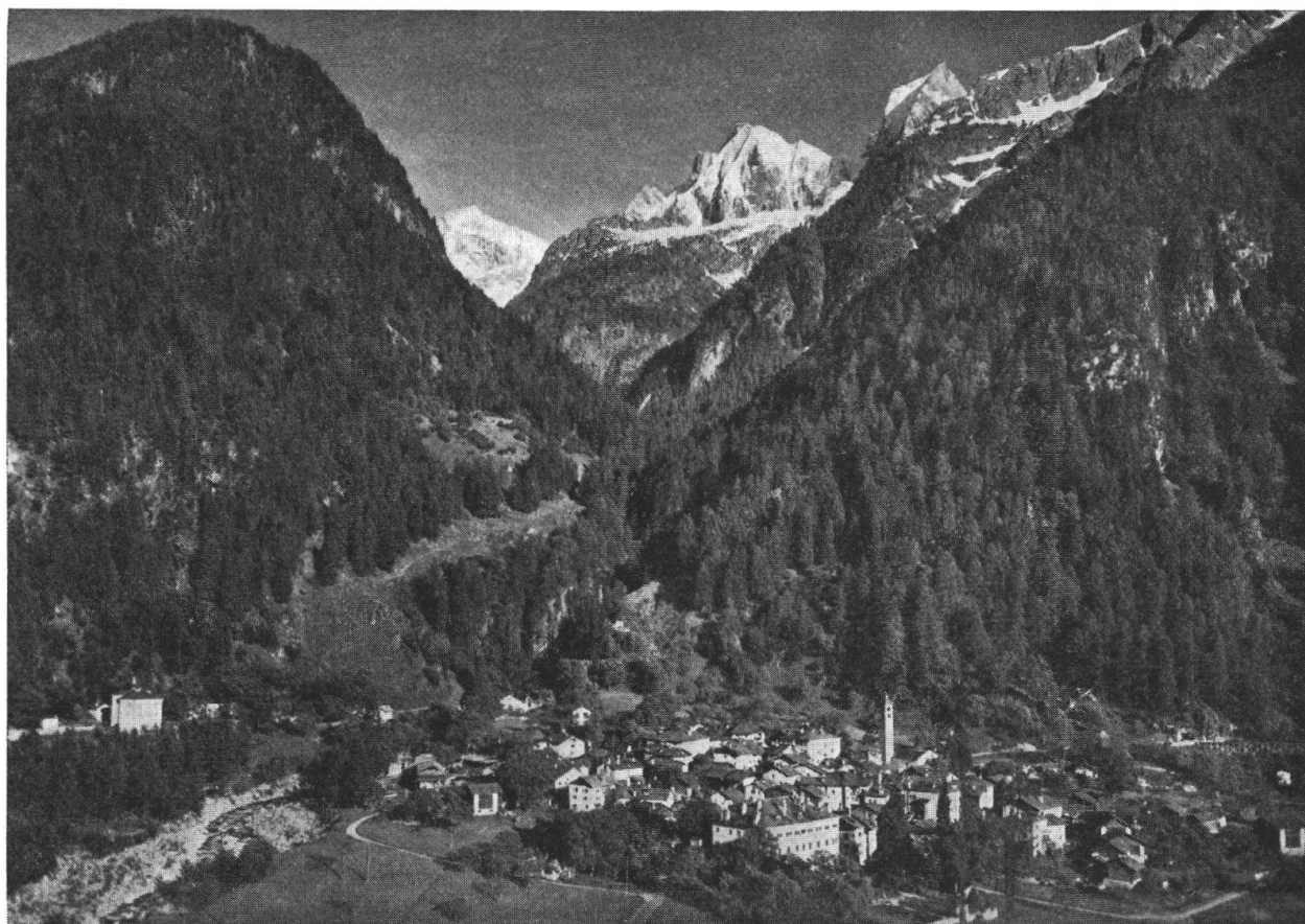
Bondo: a sinistra in basso il palazzo scolastico.

«...in tutto la summa di 62 zecchini F 43 i quali furono goduti in un festino di ballo in buona unione».