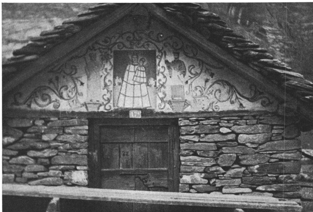
Bodio — Cauco: affresco su stalla, restaurato