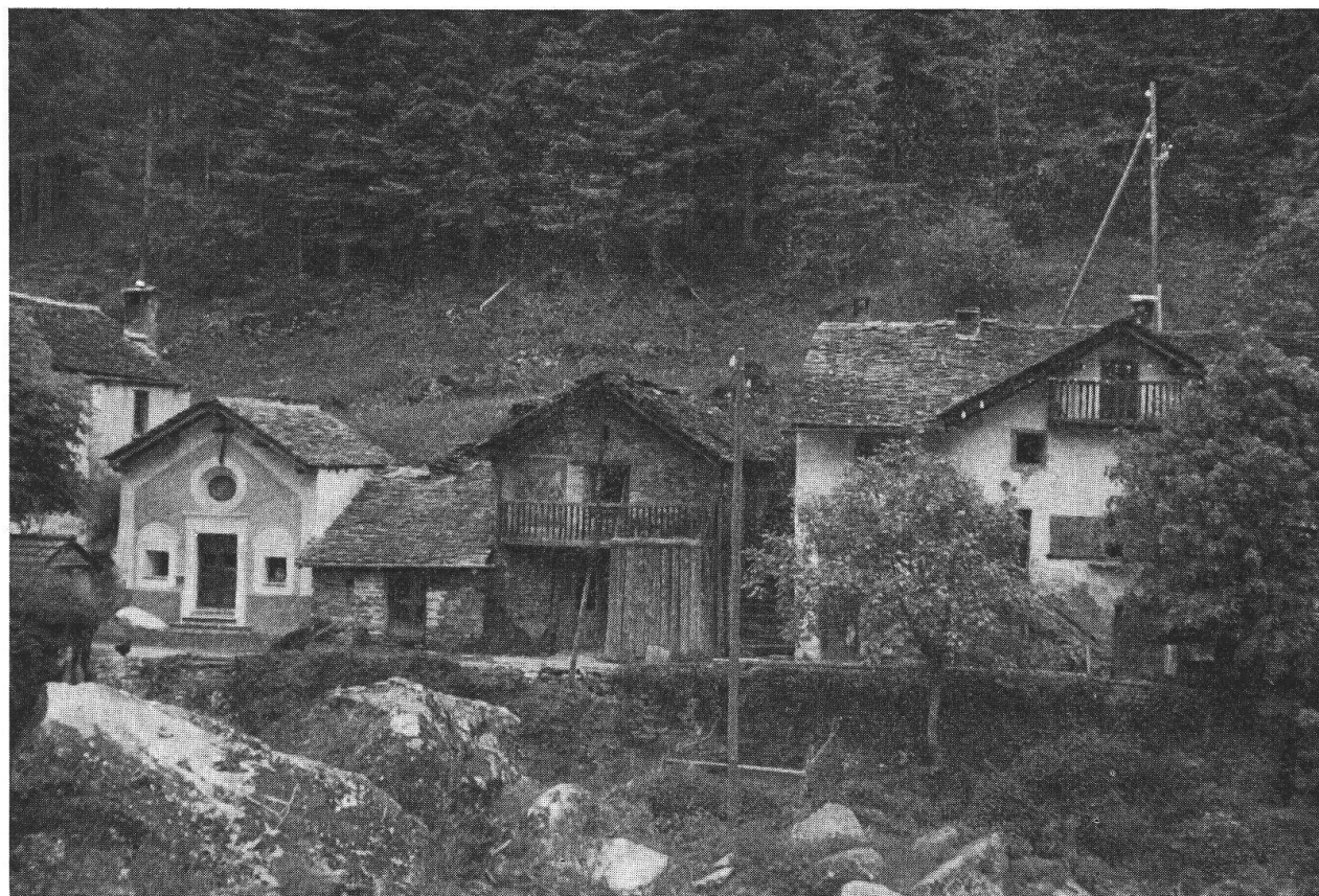
Arvigo - Al Ponte: la Fondazione Museo Moesano ha fatto restaurare la facciata della cappella e l'affresco sulla stalla al centro