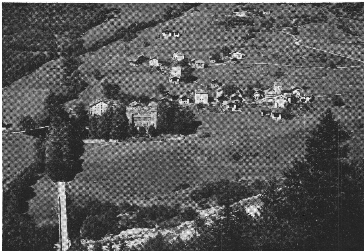
COLTURA, vista generale. Circa nel centro il palazzo Castelmur. A sinistra in basso il Ponte Nuovo sulla Maira

tria, la partecipazione volontaria al finanziamento della stazione telegrafica a Castasegna, a istituzioni religiose e sociali a Marsiglia, a fuggiaschi polacchi, 500.— franchi per l'acquisto di una pompa comunale, poi il Barone pagava «palorme» e casse da morto, faceva doni alla cassa pauperile, alla Società storica a Coira ed alla Società Bersaglieri a Stampa. Negli atti c'è la domanda d'aiuto di un maestro che aveva insegnato a Stampa e che poi si era stabilito a Campovasto, diventato cieco, un documento commovente. Anche un parroco cattolico di Savogno supplicava soldi per l'istruzione scolastica di tre giovani della sua parrocchia, ed il parroco di Poschiavo interveniva a favore di una vedova Castelmur a Poschiavo.