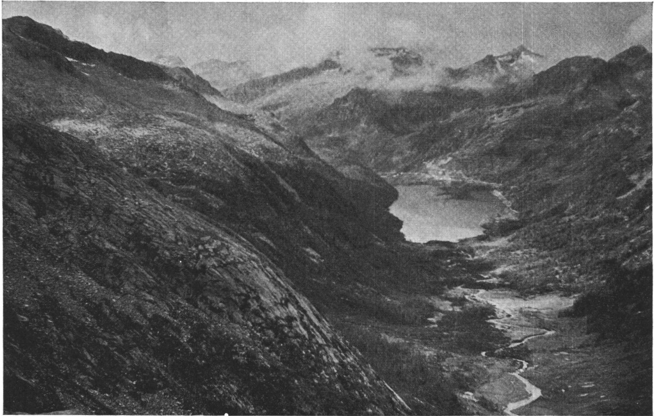
Val di Fumo. Il Coster di Sinistra. Esso appartiene al sistema erosivo « Pian del Meden » e costituisce il testimonio più evidente di un vecchio fondo di valle del periodo pliocenico. Sul fondovalle il bacino artificiale della Val di Fumo.