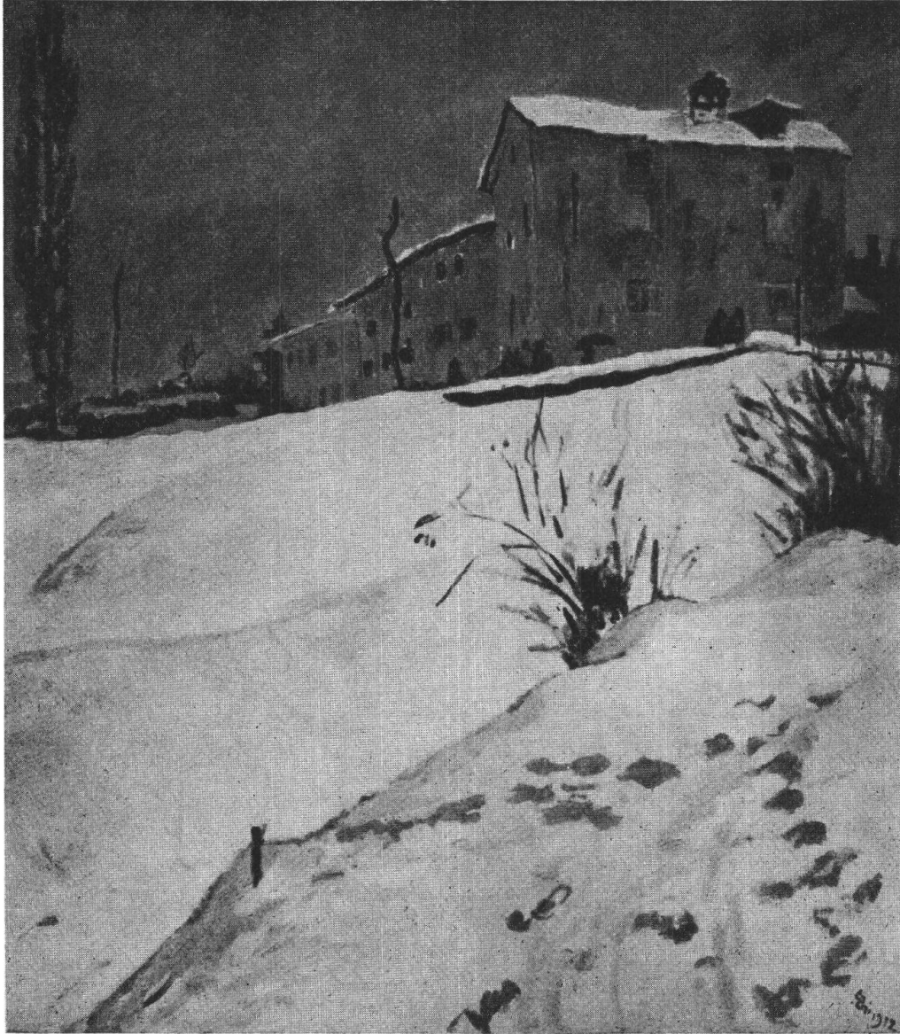
Giovanni Giacometti: Casa rossa (1912)