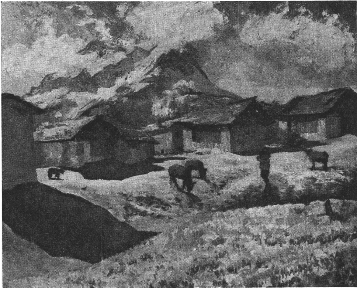
Giovanni Giacometti: Autunno a Capolago (1928)