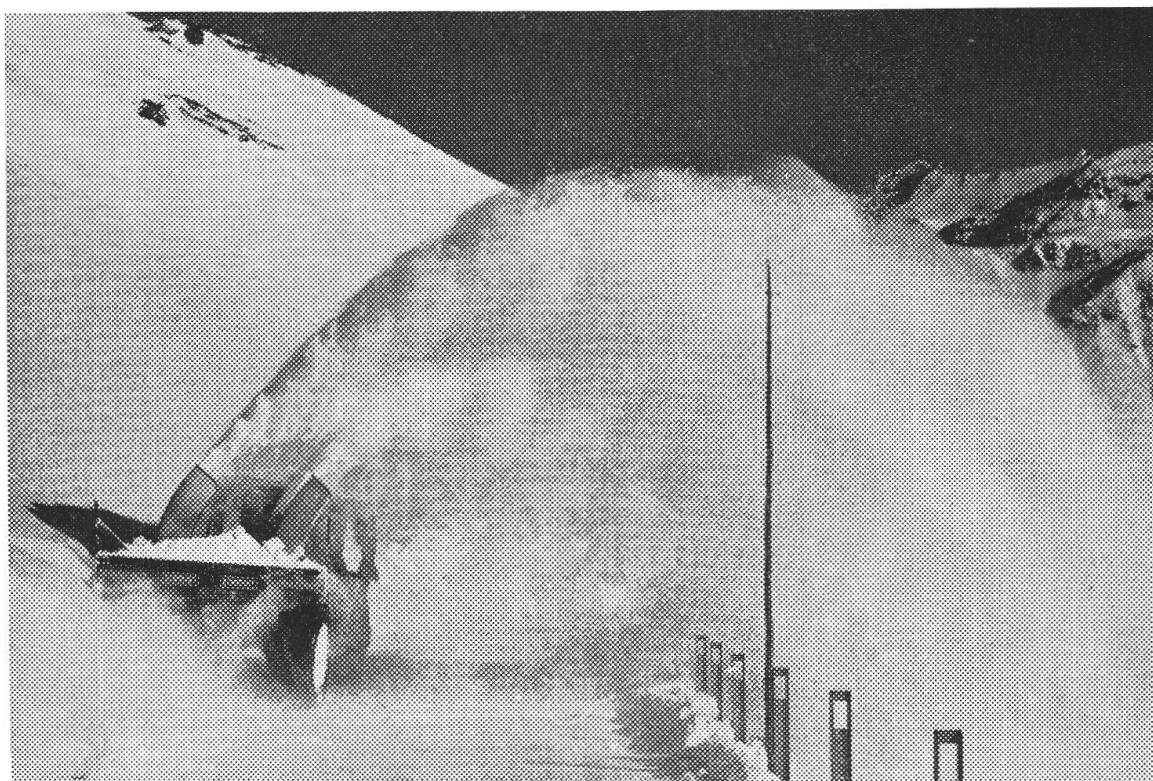
La fresatrice del Bernina, una Mercedes con un motore per la trazione e uno per il rullo escavatore, impiegata in cima alla rampa sud del valico dove la strada è adattata alle esigenze del traffico odierno

Gli ultimi statuti aggiudicano il compito di tener aperto il valico alle autorità, che potevano farsi sostituire da persone idonee a questo lavoro. La strada doveva dunque essere tenuta aperta dal comune. Ciò risulta anche da un atto del 7 febbraio 1849 secondo il quale per questo lavoro venivano impiegati sei « rotteri », senza salario. Essi godevano però del privilegio « d'esser preferiti a ogni altro vetturino nella condotta e ricondotta delle merci » e in più del diritto di « percepire la così detta rotta, val a dire due bazzi per slitta ed un cruzzero per ogni cavallo la prima volta che passavano e poscia solo la metà, sempre trattandosi di slitte appartenenti a stranieri ». 4) Quando il lavoro superava le possibilità dei « rotteri », potevano trasportare merci anche altri tenitori di cavalli.