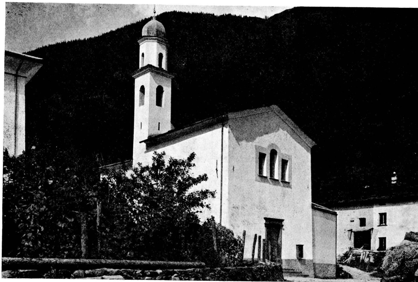
Chiesa di Pagnoncini