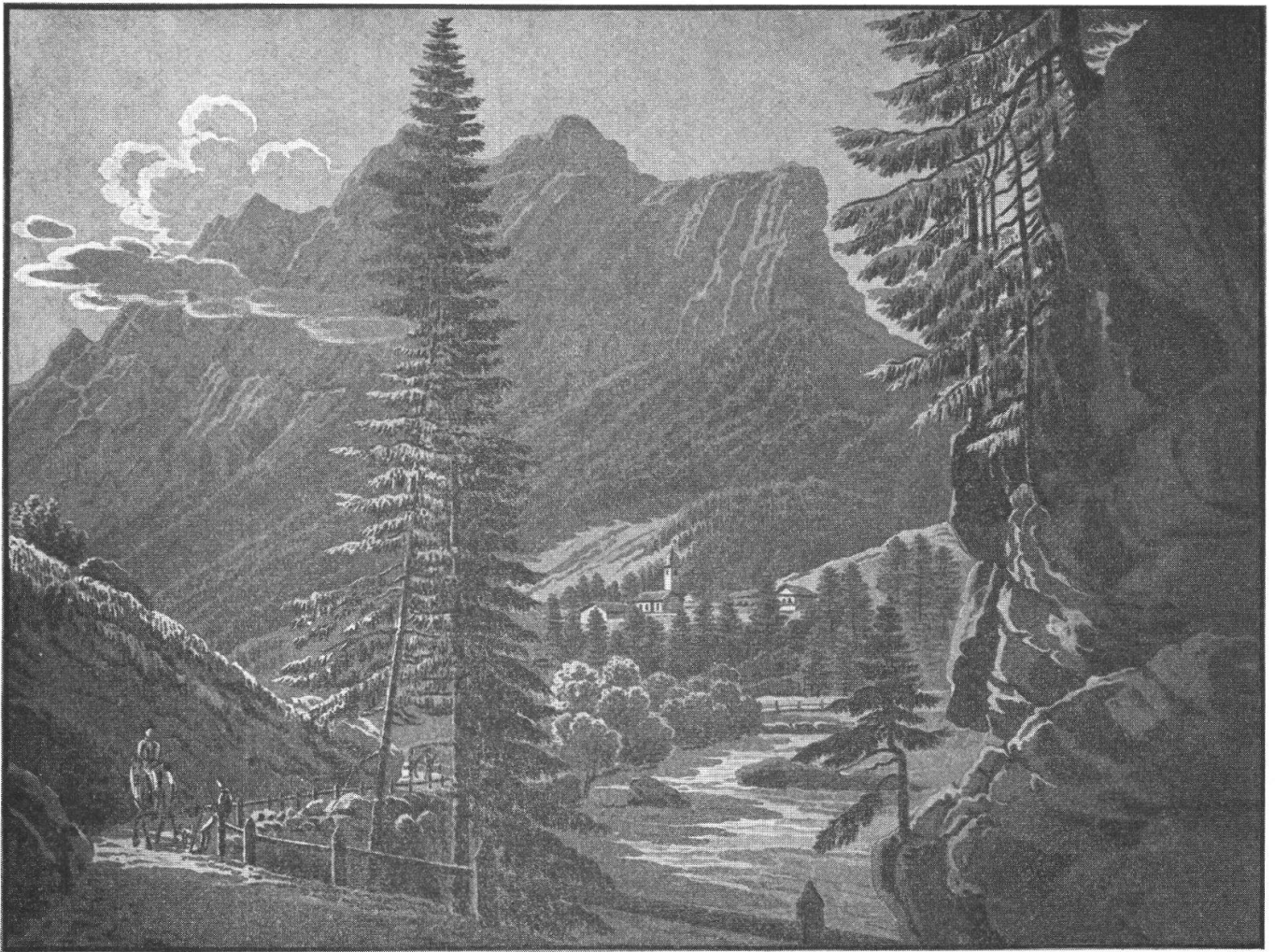
J. J. Meyer, 1825: Sufers

Schwartz, che possedeva già una casa con ricchi rivestimenti in legno in città, presso il Rathaus e che a quel tempo si diede ancora una specie di residenza estiva sulla sinistra della Plessur, nel « Sand »: residenza che non era sdegnata dagli Ambasciatori stranieri. Più difficile era accontentare simili esigenze entro le mura. La poca riserva di terreno non ancora edificato era costituita dall'area sopra San Martino, fra la corporazione dei sarti e il muro dell'Hof, e lì Carlo de Salis costruì nel 1640 la prima casa patrizia entro le mura di Coira, nello spirito del primo barocco, come corpo architettonico isolato e aperto in cortile porticato. Circa quarant'anni dopo vi si accostò l'imponente casa Buol, che oggi ospita il Museo Retico, edificata sull'antico cortile di San Martino al posto del vecchio arsenale ».