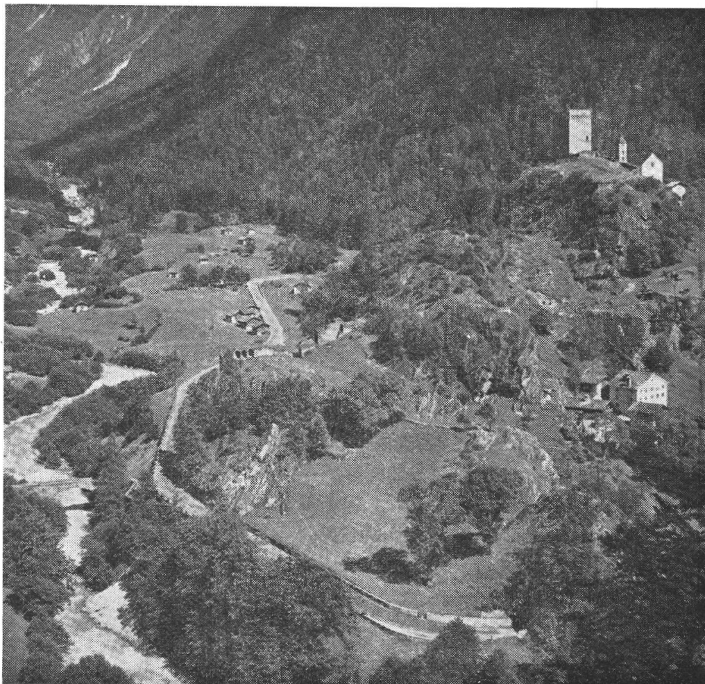
La Müräia e Nossa Donna, da SO.