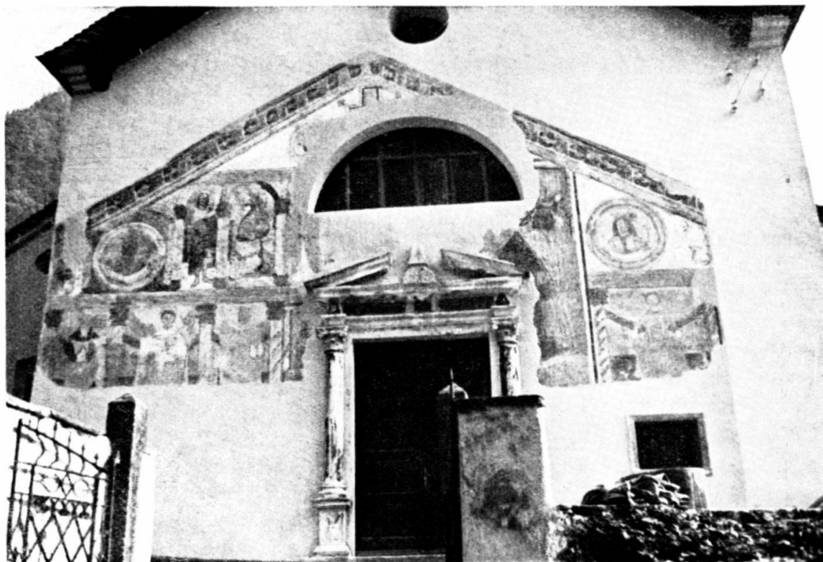
SOAZZA — Chiesa Parrocchiale: Facciata primitiva, con affreschi