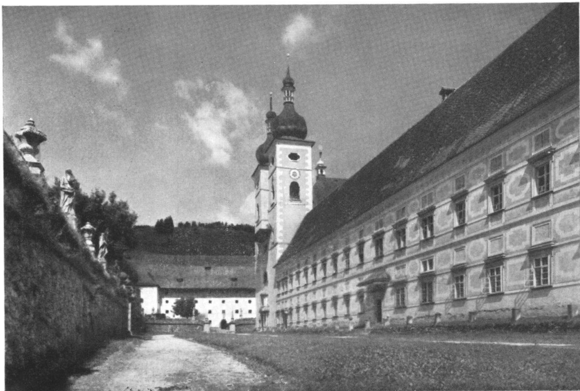
Domenico Sciascia, St. Lambrecht, Convento, dopo 1640