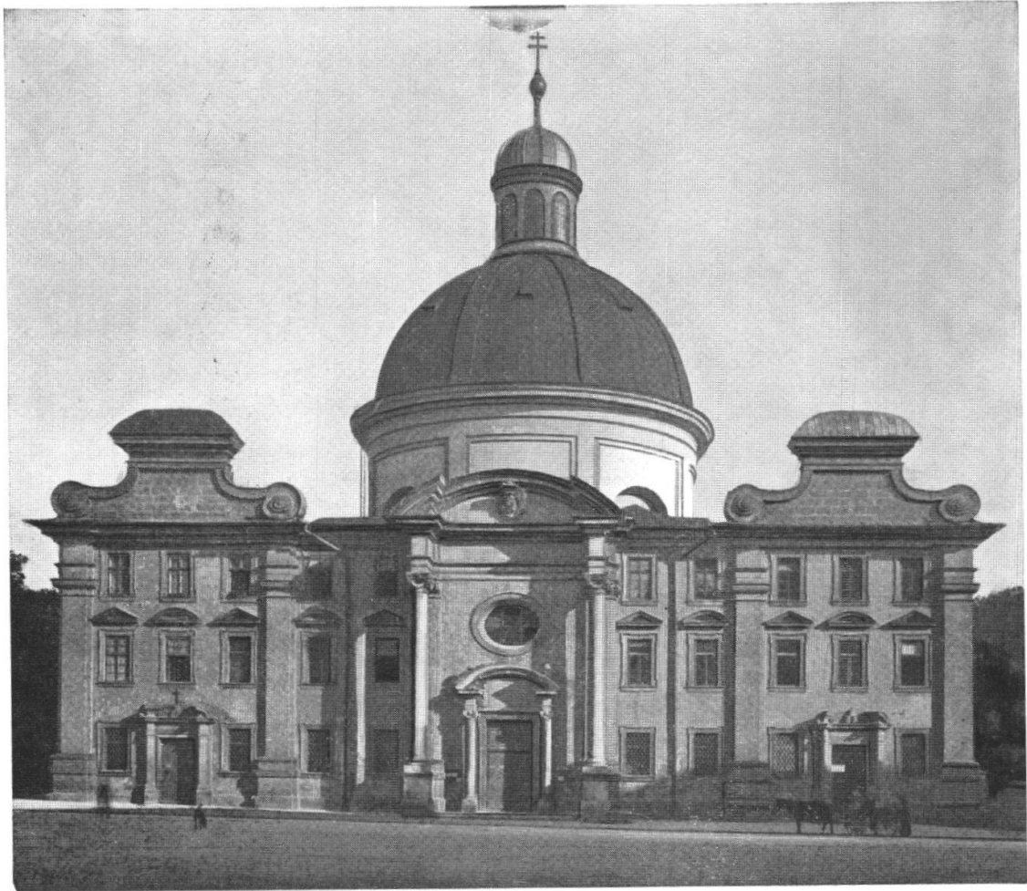
Giov. Gaspare Zuccalli, Salisburgo, Chiesa dei Teatini, inizio 1685