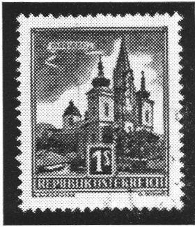
Mariazell, chiesa votiva Francobollo di 1 SL.