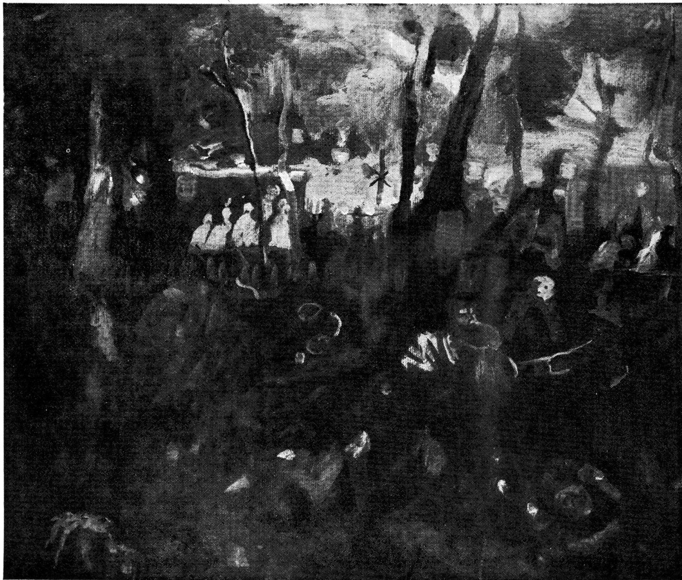
„La Madonna delle motociclette nel bosco Isolino di Locarno“, tempera, 1951