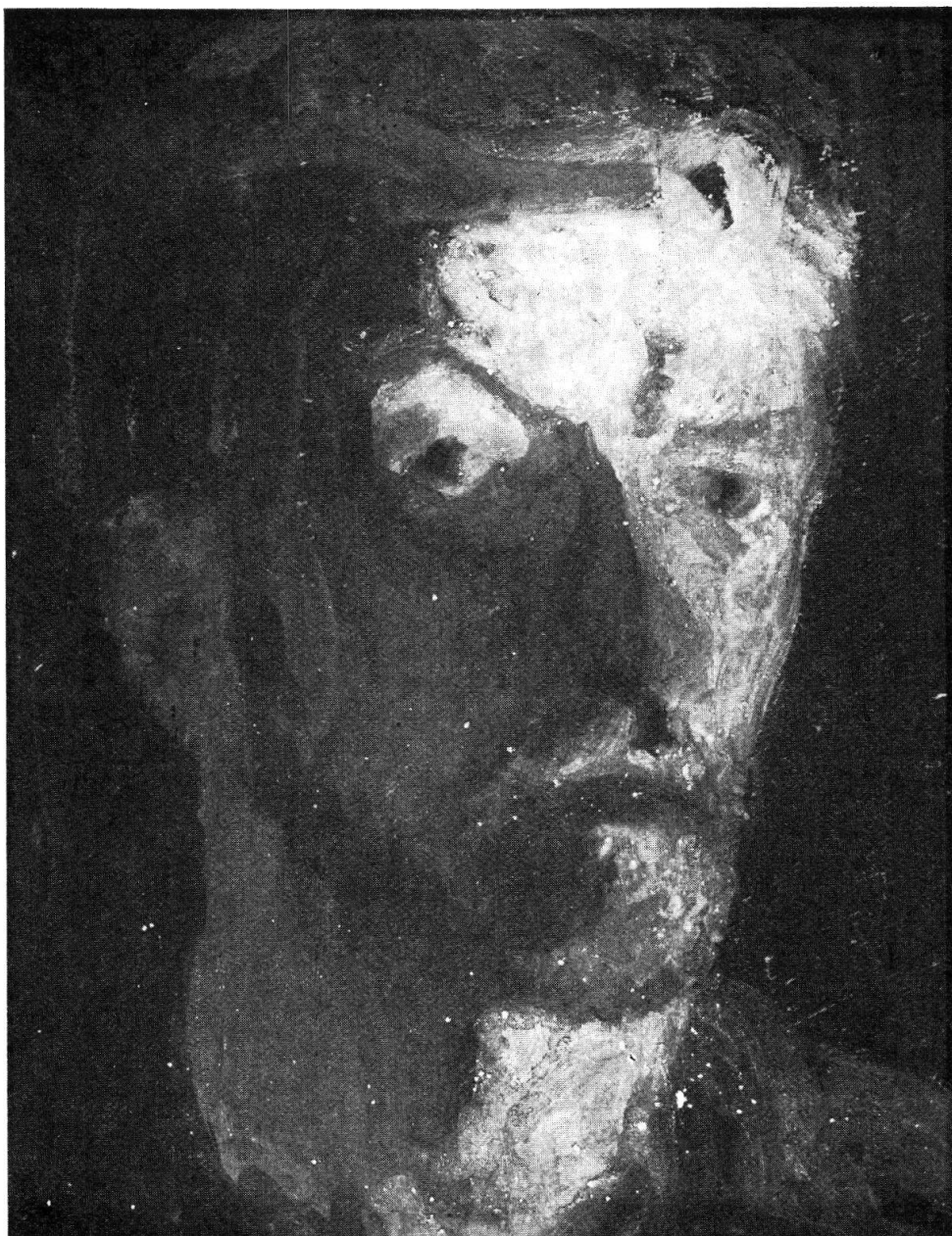
„Autoritratto“, tempera. 1951