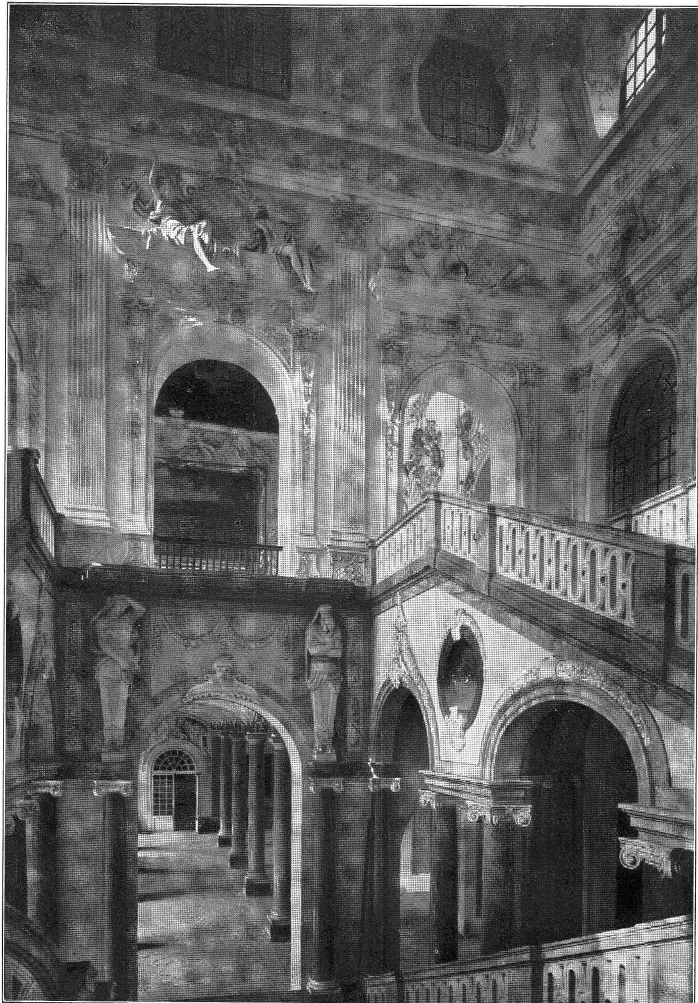
Schleissheim, Interno : la Scala magna.