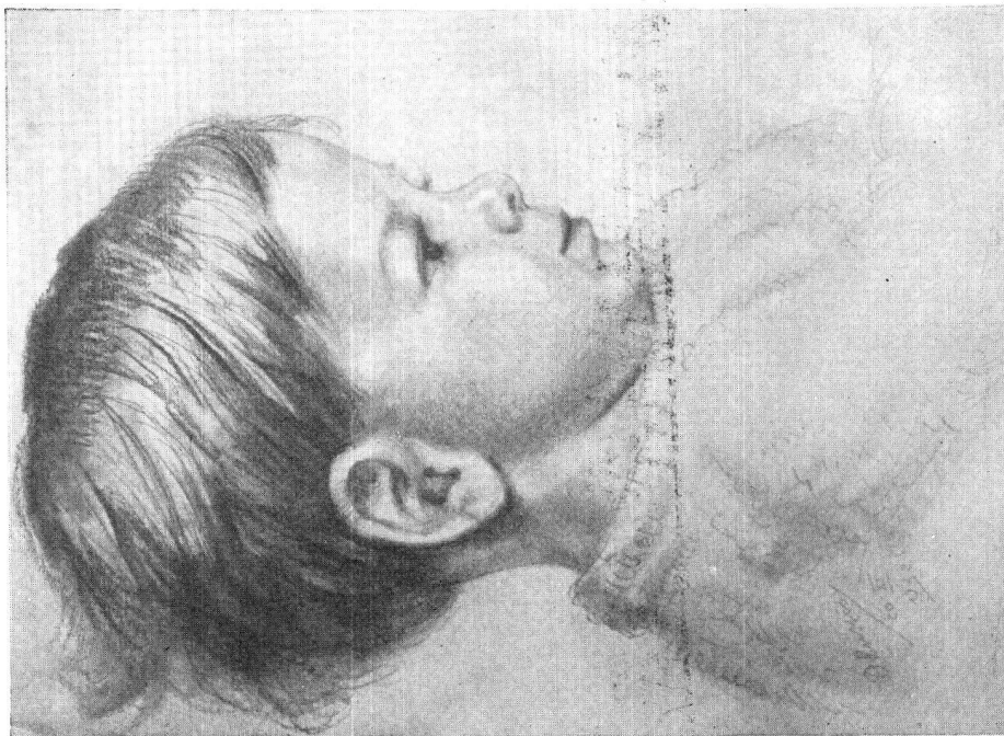
Oscar Nussio / Testa di bimbo