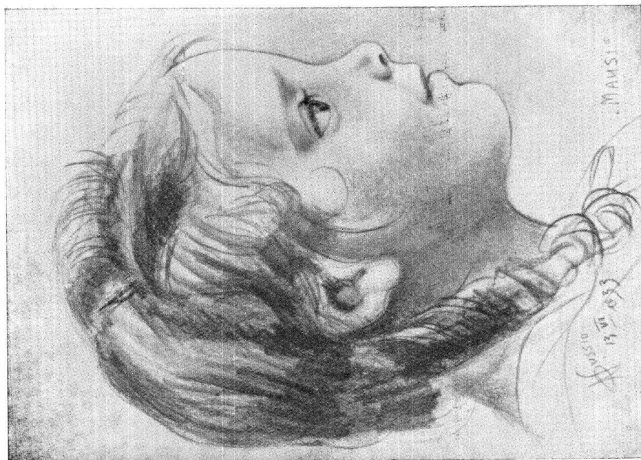
Oscar Nussio / Testa di bimba