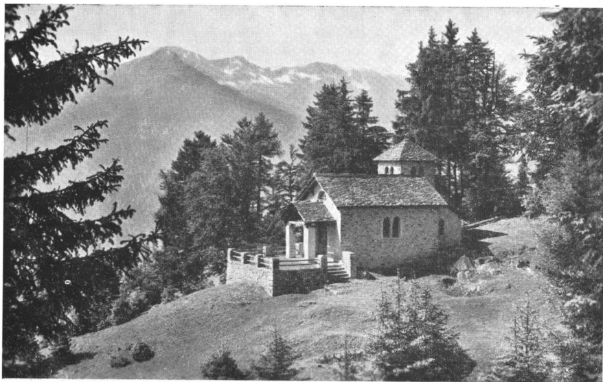
LAURA, la chiesetta (arch. Enea Tallone)