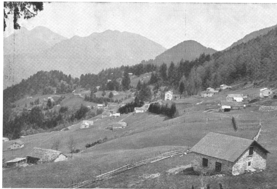
LAURA di Roveredo veduta da occidente