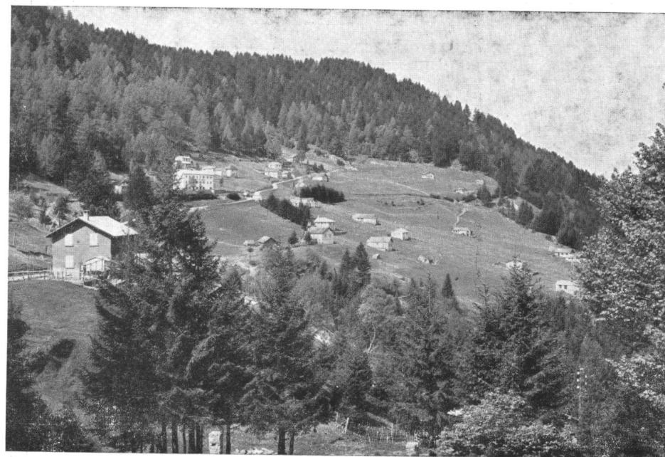
LAURA di Roveredo, veduta da oriente