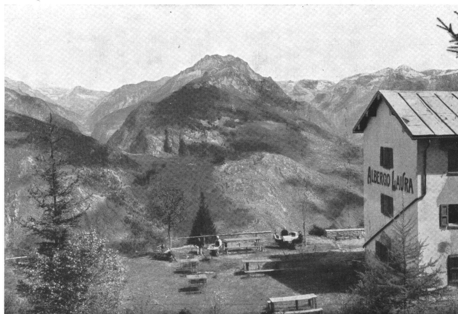
LAURA di Roveredo. Sguardo sul massiccio del Groven: a sinistra la Calanca, a destra la Mesolcina