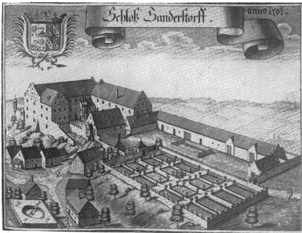
IL CASTELLO DI SANDERSDORF nel 1701.