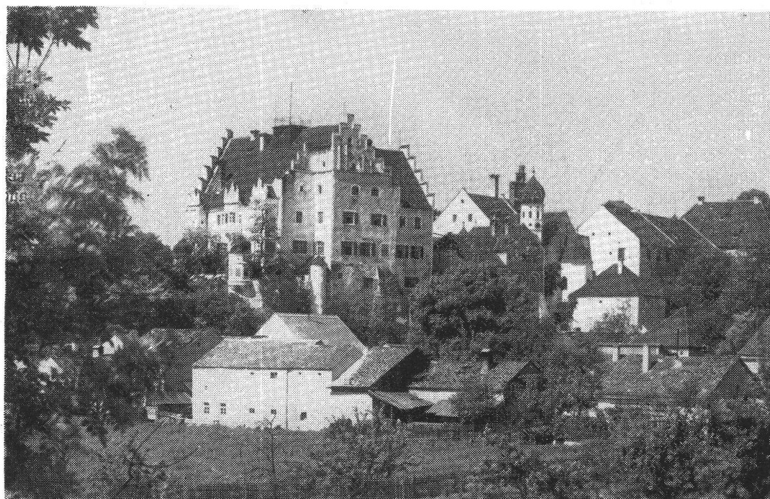
IL CASTELLO DI SANDERSDORF.