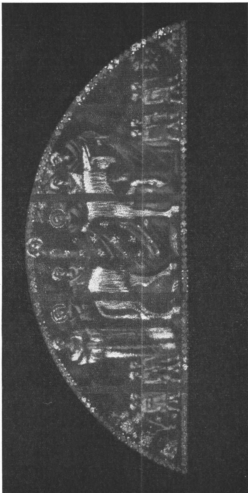
L' ENTRATA DI GESÙ IN GERUSALEMME.