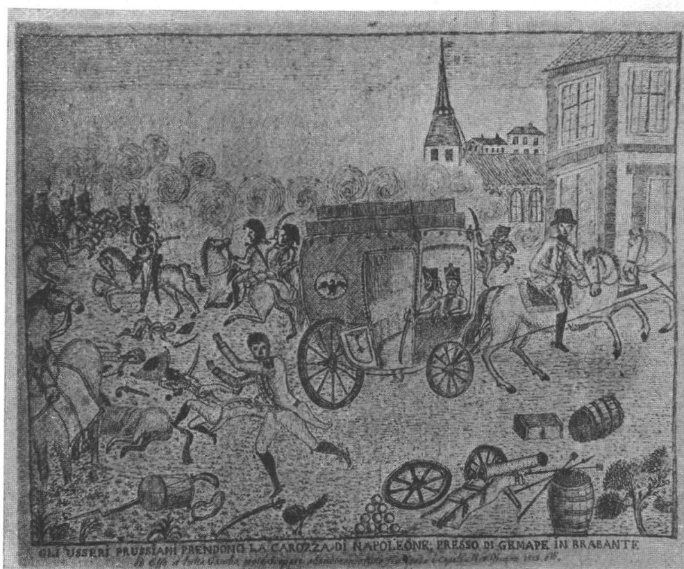
DISEGNO DI G. A. MAURIZIO.

le su riferite potenze cioè Russia, Prussia, Austria, Baviera, Württemberg , ed altri principi di Germania ed anche l' Inghilterra d'armarsi e marciar novamente contro la Francia con poderoso esercito e molto accanimento verso Napalioneone . Particolarmente li prussiani, che erano stufi della visita dei francesi nel loro paese, sono stati li primi a fronte delle napoleoniche truppe nell' Olanda e Paesi Bassi . Uniti agli inglesi, il generale Wellington comandava questi ed il general Blucher comandava li prussiani, ma ambi di comune accordo nelle loro operazioni militari. Napoleone marciò verso loro con grandissimo esercito coll'intenzione di battere questi due sopradetti generali prima che arrivassero li russi ed austriaci ed altri che erano ancora di dietro delle frontiere di Francia . Ma la faccenda non andò a favore dei francesi come se l'avrebbe creduto come qui sotto dirò.