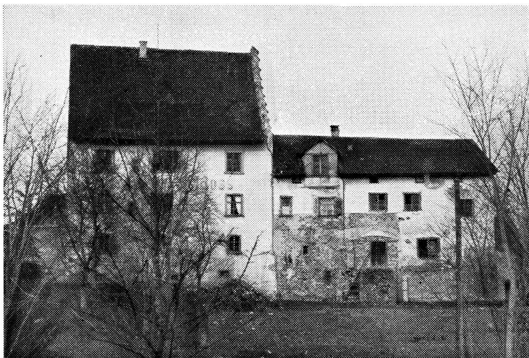
IL CASTELLO COME ERA.

Dai bei giorni delle ultime maestranze mesolcinesi dell'arte muraria sono trascorsi quasi due secoli, in cui, per quanto sappiamo, le Valli non hanno dato un unico costruttore di qualche nome. Ora però là su quel di Weinfelden sta affermandosi l'architetto Paolo Nisoli , di Grono di Mesolcina, che è stato rivelato ai convalligiani nell'ultimo Almanacco dei Grigioni (1932). E proprio di recente egli ha condotto a fine un'opera che gli è valsa di bel vanto: il rimodernamento del castello di Bischofszell .