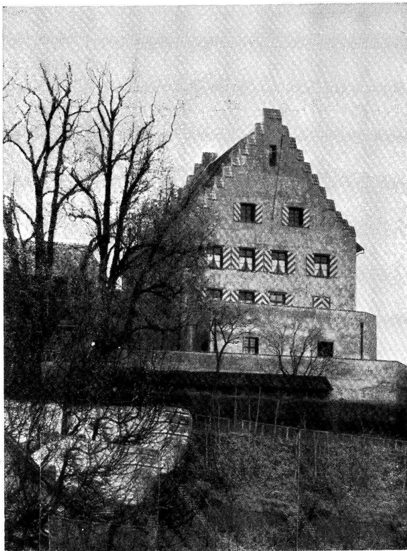
IL CASTELLO COME ORA È (veduto di fronte).