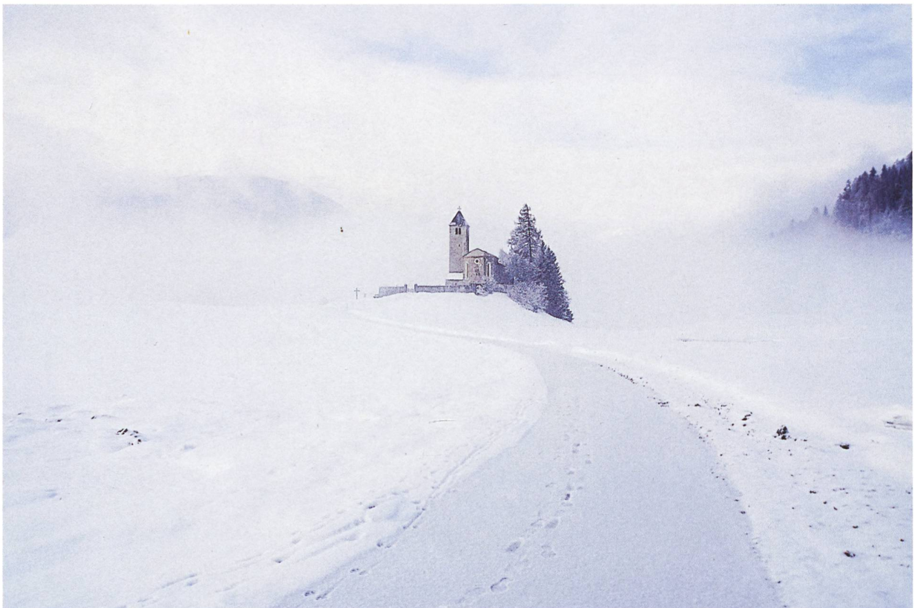
Alte Pfarrkirche St. Maria in Lantsch/Lenz, von Nordosten gesehen.