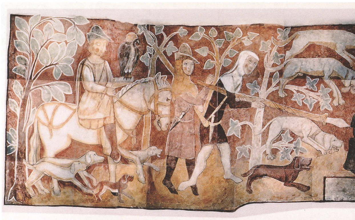
Abb. 4 Darstellung einer Bärenjagd an der Westfront von Schloss Rhäzüns, kurz nach 1350 entstanden (Foto: Kantonale Denkmalpflege, Chur).