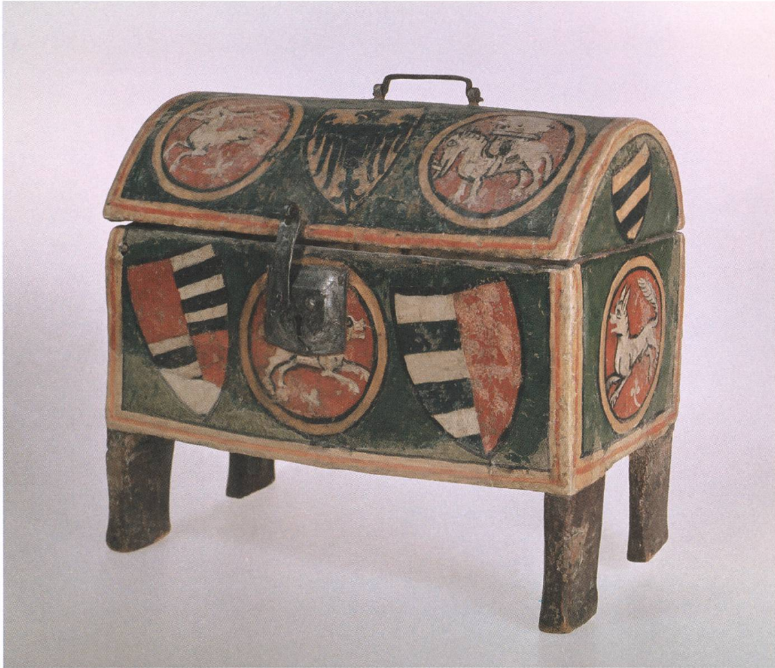
Abb. 2 Das Minnekästchen von Scheid aus der 1. Hälfte des 14. Jahrhunderts. Auf der Frontseite die Schilde der Freiherren von Rhäzüns (rechts) und Montalt, auf dem gewölbten Deckel seitlich rechts das Wappen der Thumb von Neuburg.