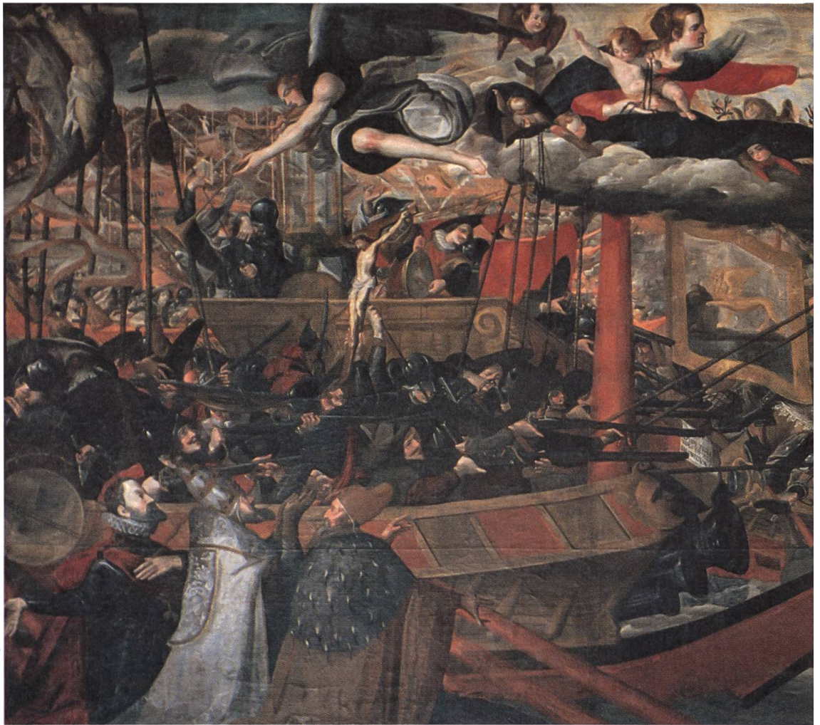
Abb. 17: Die Schlacht von Lepanto, 1571. Ölgemälde von Giovanni Battista Macholino aus dem Jahre 1630 in der Pfarrkirche von Pleif/Vella.

längere Zeit aus den venezianischen Apotheken nach Graubünden exportiert wurde und hier sehr verbreitet war: die «triacca/triacha». Heute versteht man in Romanischbünden unter diesem Begriff ein minderwertiges Mischgetränk. Ursprünglich galt «triacca» als ein Mittel gegen Schlangenbiss, später wurde es zum Universalheilmittel in der Form einer Latwerge und wurde seit dem 16. Jahrhundert in Venedig, Holland und Frankreich hergestellt. Nach Graubünden gelangte die venezianische