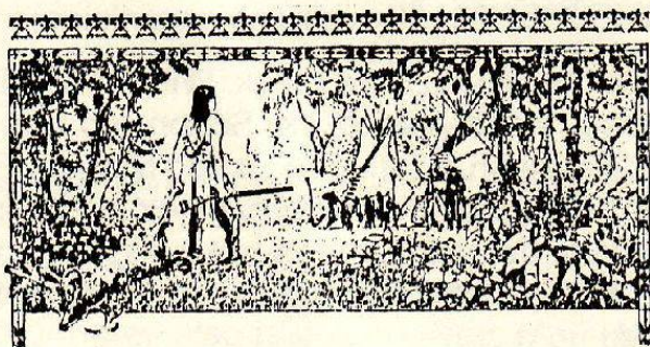
Regina Personeni, Hans Witschi

In erinnerung bleiben auch die langen abende im pub oder im boot, der geruch der makrelen, vermischt mit «amsterdamer», das geräusch der regelmässig an die masten schlagenden seile, die stöhnenden barken, die massé-stösse auf den zerschundenen billiardtischen. Die fischer in Holland sagen: «Lieber auf dem schiff leben, als auf dem land, das jederzeit weggespült werden kann».