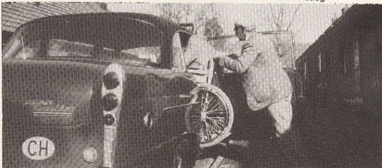
Bild nr. 1 mühsamer einstieg