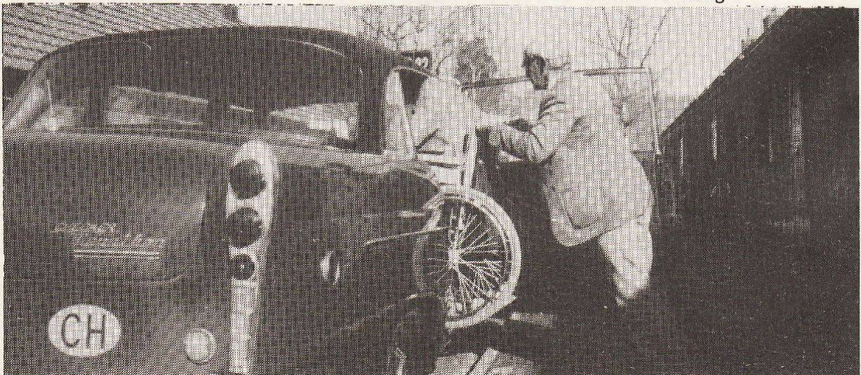
Bild nr. 1 mühsamer einstieg