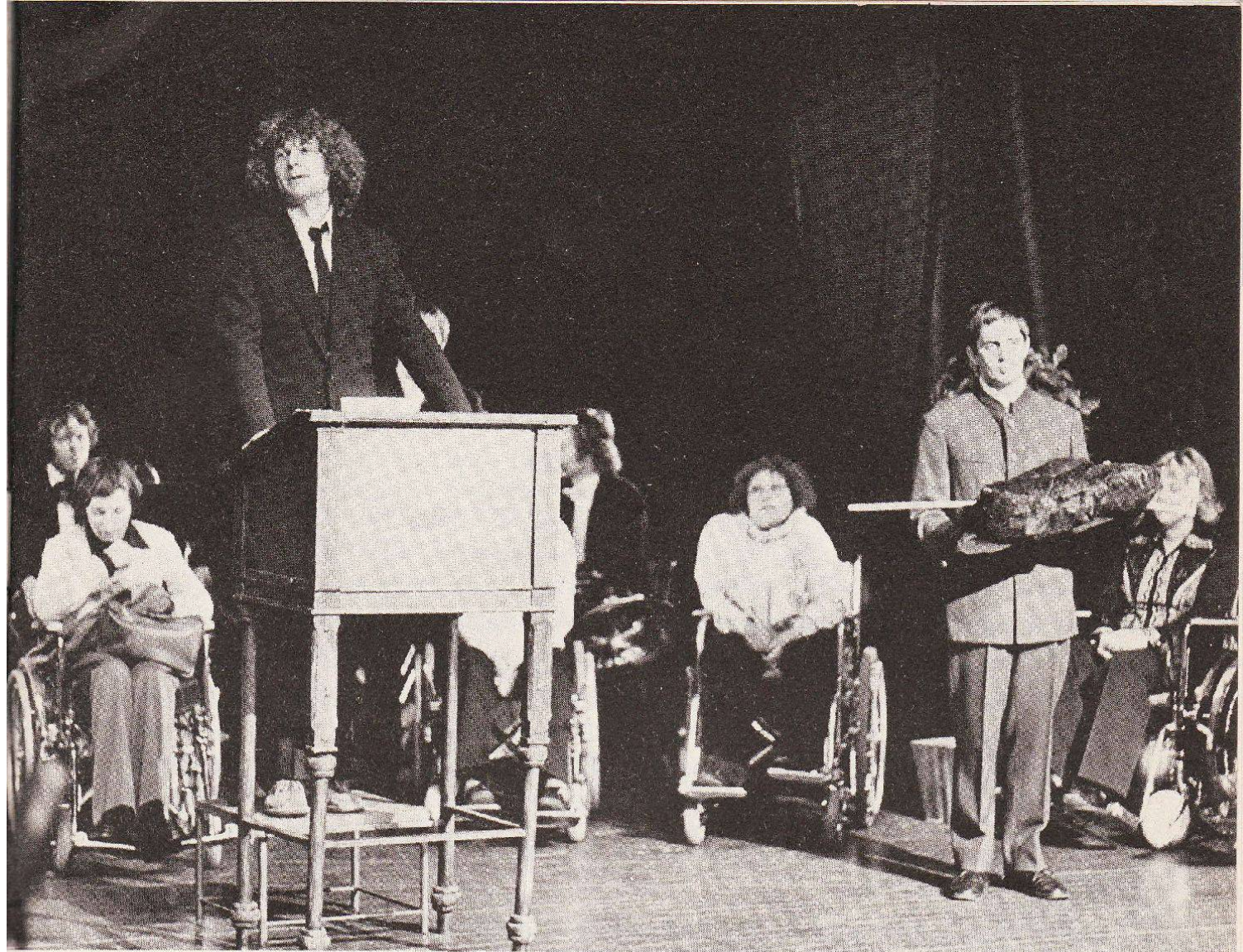
Verleihung der goldenen krücke

erst um 22 uhr eingehalten, so dass sich die betroffenen nach mehrstündigem warten, entweder schon im bett befanden oder sehr verärgert im aufenthaltsraum sassen. Es zeigte sich bei den gesprächen einmal mehr, dass es von den strukturellen bedingungen eines heimes her nicht möglich ist, normale sexuelle beziehungen in- und ausserhalb eines heimes aufzubauen.