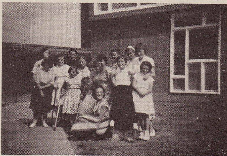
DAS ERSTE RIM-LAGER IN EINSIEDELN 1959

Der heutige hauptredaktor übernahm sein amt im frühjahr 1960. Der name des vereins lautete von anfang an "Ring invalider Mädchen" (RIM); daraus konnte man auch ablesen, dass es sich um eine gruppe behinderter mädchen handelte, die vom Blauring und gefaltetes blatt, das die neuesten meldungen enthielt und ein erbauliches wort des hörte.