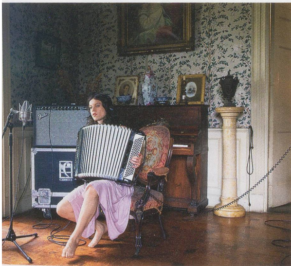
RAGNAR KJARTANSSON, THE VISITORS , 2012, 9-channel HD video, color, sound, loop, 64 min / DIE BESUCHER , 9-Kanal-HD-Video, Farbe, Klang, Loop, 64 Min.

Äusserst wendig und geschickt verschärft Kjartanssons Werk die im Text von «Sorrow» implizierte emotionale Sackgasse noch und nimmt sie zugleich kritisch ins Visier; der Song endet mit dem wohlfeilen Satz, «I don't want to get over you.» Diese lyrische Erklärung eines bewussten In-der-Klemme-Verharrens, des sturen Festhaltens an der depressiven Haltung ist der emotionale Angelpunkt des Songs. Zwischen Selbstmitleid und Selbstverachtung schwebend wiederholt sich diese ausdrückliche Weigerung der Libidoablösung auf hinreissende Weise und verhartet hartnäckig an Ort, statt den Wogen der sie umspielenden Musik zu folgen, und geht dann weiter. Es ist eine melancholische Hymne von der unerschütterlichen Hingabe an eine verlorene Sache, die ein verzweifelter Mensch endlos wiederholen könnte, indem er im Schmerz verharrend immer wieder die Play-Taste drückt. Es besteht ein seltsames mimetisches Band zwischen den Musikern, deren Stück einen Stillstand ausdrückt, und