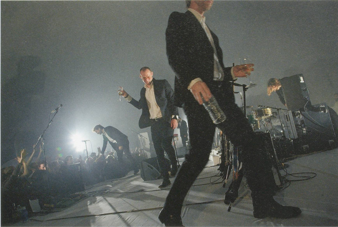
RAGNAR KJARTANSSON, A LOT OF SORROW , 2013, performance, 6 hrs, featuring The National , MoMA PS1, New York / JEDE MENGE SORGEN , Performance, 6 Std, gespielt von The National .

early video works focus upon the figure of the artist as musical sage, intoning mantras of guilt and defeat whose stark simplicity becomes increasingly unraveled by a jarring syntax of repetition. In MERCY (2005), Kjartansson strums an acoustic guitar and, addressing the camera, continually asks, “Oh, why do I keep on hurting you?” for an hour. 2) No answer arrives. Styled like Sinatra against a lurid hot-pink backdrop with a large musical ensemble accompanying him in GOD (2007), he intones, “Sorrow conquers happiness” for forty minutes, a melancholic pronouncement slyly at odds with the lush scenery and chamber-jazz arrangement. For his live presentation at Performa 11 in New York, Kjartansson extended the duration of twelve hours: BLISS (2011) looped the aria that concludes Mozart’s Marriage of Figaro for twelve hours, delivering a curiously straightforward reaffirmation of its lyric emotional core, “All will now be happy.” 3)