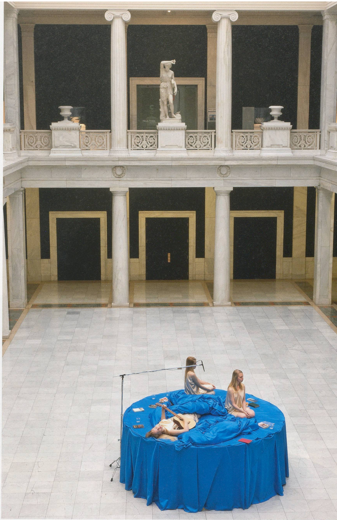
RAGNAR KJARTANSSON, SONG, 2011. performance, 6 hrs, Carnegie Museum of Art, Pittsburgh / LIED, Performance, 6 Std.