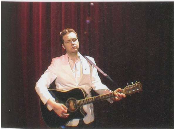
RAGNAR KJARTANSSON, MERCY , 2004, video still, video, color, sound, loop, 62 min 30 sec / GNADÉ , Video Still, Farbe, Klang, Loop.

Die Kritik schluckte den Köder und beschränkte sich bisher hauptsächlich auf die Frage nach der Intention: Ist das ernst gemeint? Andererseits ist eine gewisse Zurückhaltung festzustellen, wenn es darum geht, die Arbeitsbedingungen und persönlichen Erfahrungen der Akteure anzusprechen, die diese anspruchsvollen Arbeiten aufführen. Der Betrachter hat jederzeit die Möglichkeit wegzugehen, die Lage des Vorführenden ist weniger komfortabel. Wie fühlt es sich wohl an, in einem Werk Ragnar Kjartanssons ge-