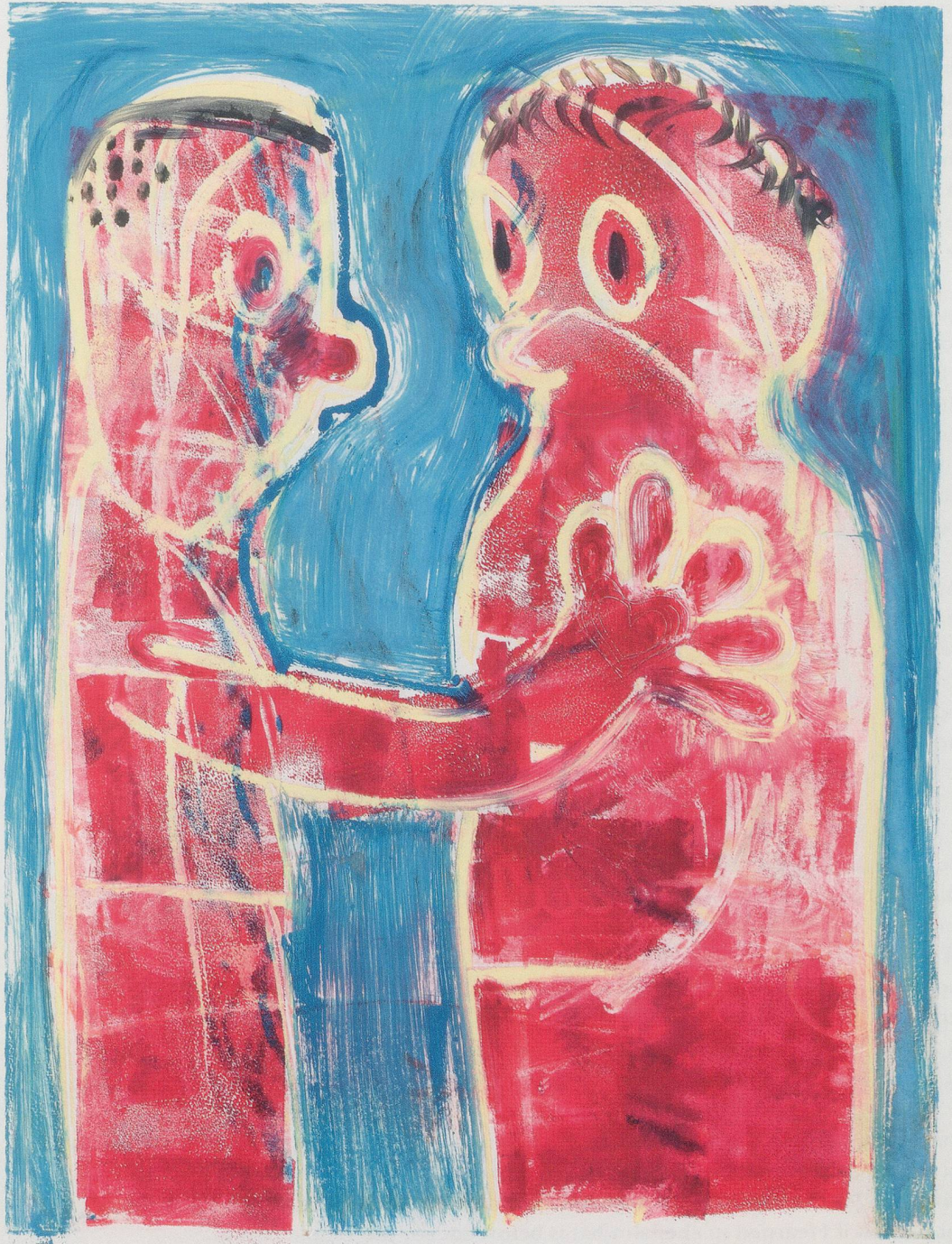
NICOLE EISENMAN, UNTITLED, 2012, monotype, 23 x 17 1/2" / OHNE TITEL, Monotypie, 58,4 x 44,5 cm.