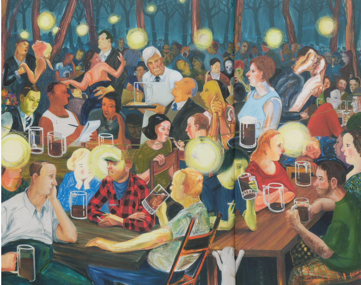
NICOLE EISENMAN, BROOKLYN BIERGARTEN II, 2008, oil on canvas, 65 x 82" / Öl auf Leinwand, 165,1 x 208,3 cm.