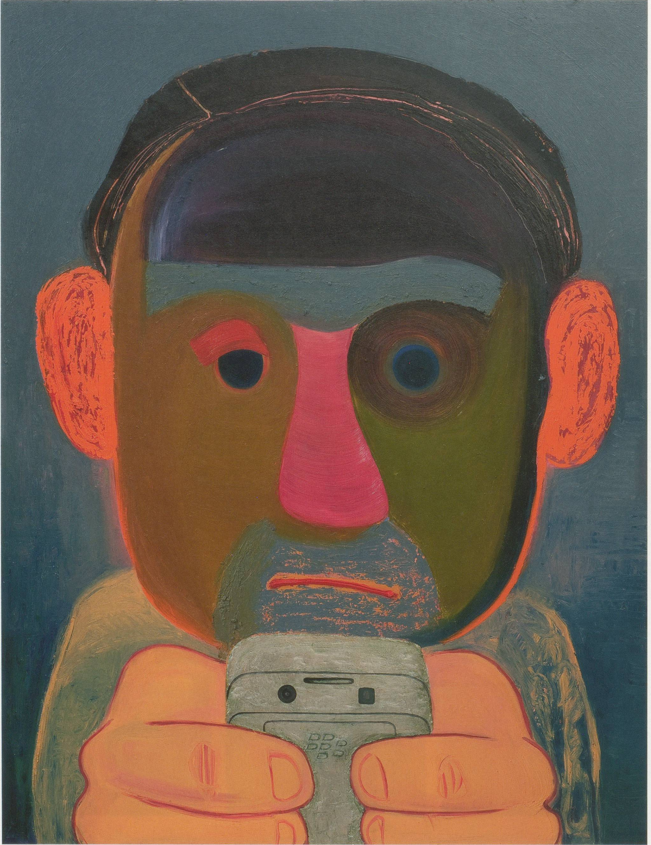
NICOLE EISENMAN, BREAKUP , 2011, oil on canvas, 56 x 43" / TRENNUNG , Öl auf Leinwand, 142,2 x 109,2 cm.