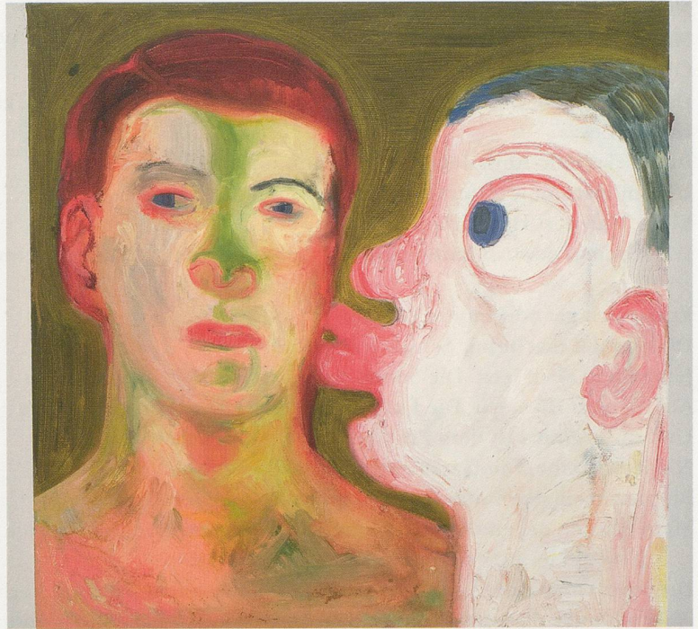
NICOLE EISENMAN, KISSING PEOPLE , 2009, oil on canvas, 12 x 12" / MENSCHEN KÜSSEN , Öl auf Leinwand, 30,5 x 30,5 cm.

Wenn die unmögliche Trauer über die Welt die sie sehen aus ihnen spricht Ich will verborgen bleiben wie eine Thorarolle im Schrein und nur am Sabbat herauskommen