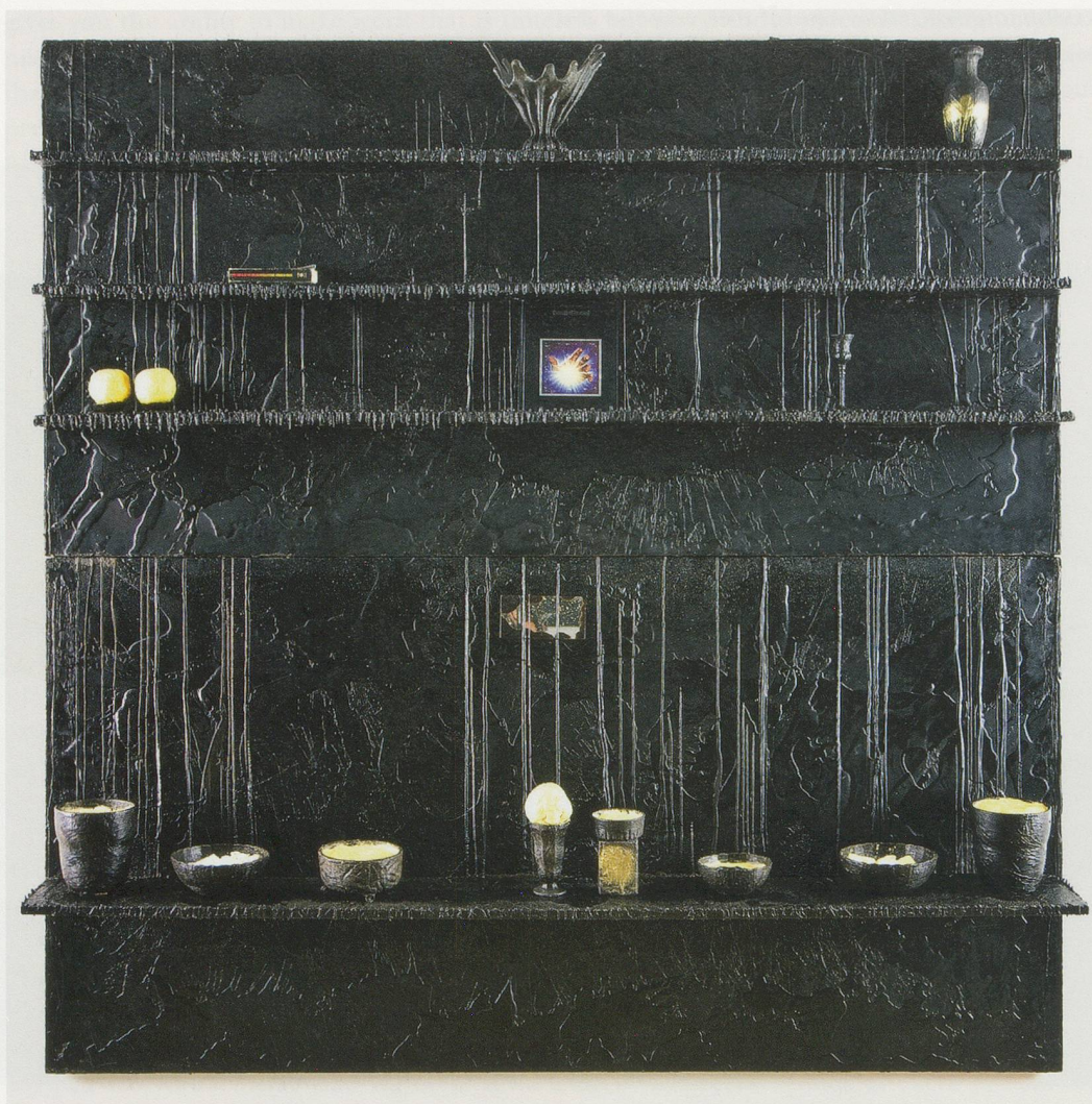
RASHID JOHNSON, CRISIS OF THE NEGRO INTELLECTUAL (POWER OF HEALING) , 2008, shelves, wax, black soap, shea butter, candles, mixed media, 96 x 96 x 12" / KRISE DES INTELLEKTUELLEN NEGERS (KRAFT DES HEILENS) , Regale, Wachs, schwarze Seife, Sheabutter, Kerzen, verschiedene Materialien, 243,8 x 243,8 x 30,5 cm.

you assume that Ra didn't sell records on Saturn? How do you think he could afford those great clothes?