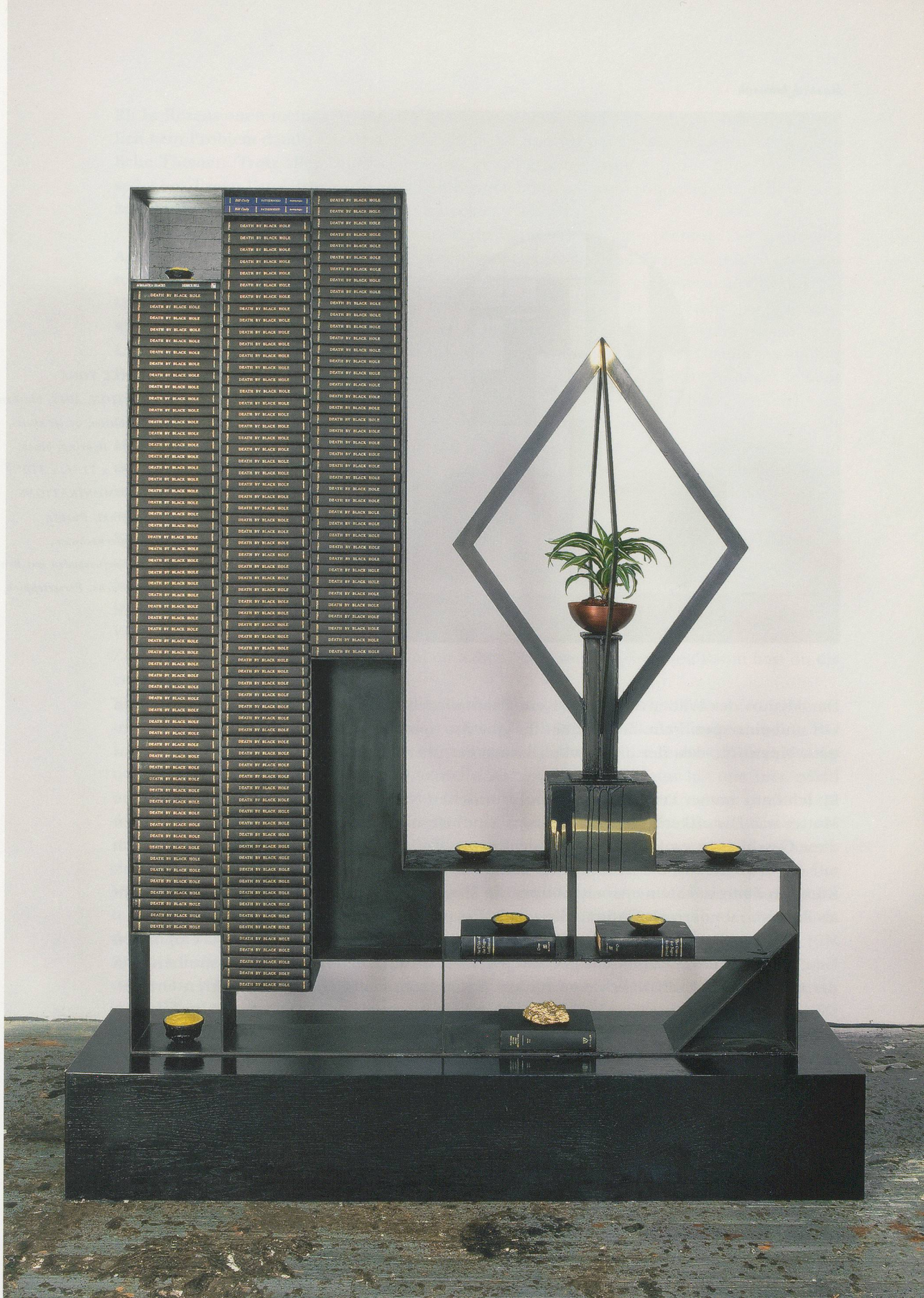
RASHID JOHNSON. DEATH BY BLACK HOLE "THE CRISIS," 2010, steel, black soap, wax, books, shea butter, plant, space rocks, mirror, gold paint, stained wood, 96 1/2 x 76 1/4 x 30" / TOT DURCH SCHWARZES LOCH «DIE KRISE», Stahl, schwarze Seife, Wachs, Bücher, Sheabutter, Pflanze, Weltraumgestein, Spiegel, Goldfarbe, gebeiztes Holz, 245,1 x 193,7 x 76,2 cm.