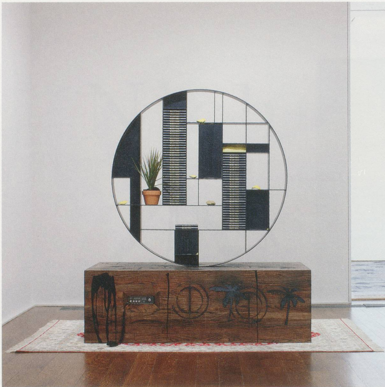
RASHID JOHNSON, BLACK YOGA COMMUNICATION STATION , 2011, blackened steel, books, plants, shea butter, oyster shells, CB radios, branded red oak flooring, black soap, wax, Persian rug, 84 x 71 1/2 x 110" / SCHWARZES YOGA KOMMUNIKATIONSSTATION, geschwärzter Stahl, Bücher, Pflanzen, Sheabutter, Austernschalen, CB-Funkgeräte, roter Eichenfußboden mit Brandmarken, schwarze Seife, Wachs, Perserteppich, 213,4 x 181,6 x 279,4 cm.

Der Mythos des Wilden Westens ist ein Phantasiegebilde, das sich auf einen spezifischen Ort und eine spezifische Zeit bezieht. Es gibt also Spuren der Vergangenheit in der Gegenwart. Meinst du, dass der historische Diskurs, der über 80 Jahre alt ist, nichts mit dir zu tun hat?