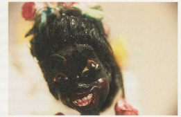
NATHALIE DJURBERG, I FOUND MYSELF ALONE, 2008, clay animation, video, music by Hans Berg, 9 min. 45 sec. / ICH FAND MICH ALLEINE WIEDER, Knetanimation, Video, Musik von Hans Berg, 9 Min. 45 Sek.