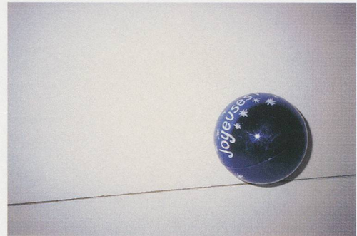
PHILIPPE PARRENO, SNOW DANCING , 1995, installation view, Le Consortium, Dijon / SCHNEETANZ, Installationsansicht.