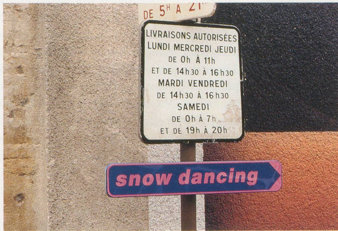
PHILIPPE PARRENO, SNOW DANCING , 1995, installation view, Le Consortium , Dijon / SCHNEETANZ , Installationsansicht.