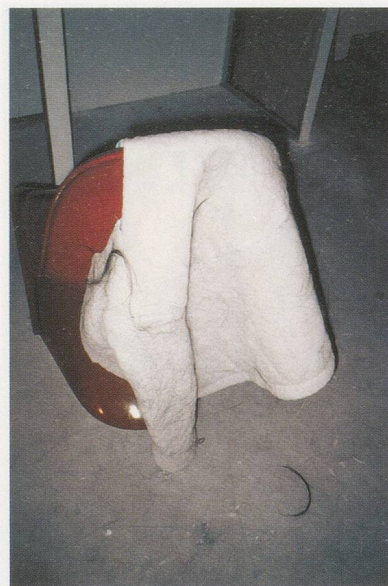
PHILIPPE PARRENO, SNOW DANCING, 1995, installation view, Le Consortium, Dijon / SCHNEETANZ, Installationsansicht.

All das ist verbunden mit Philippes Entschlossenheit, mit Leuten zu arbeiten, mit denen die Zusammenarbeit schwierig ist. Dazu gehört auch, gegen