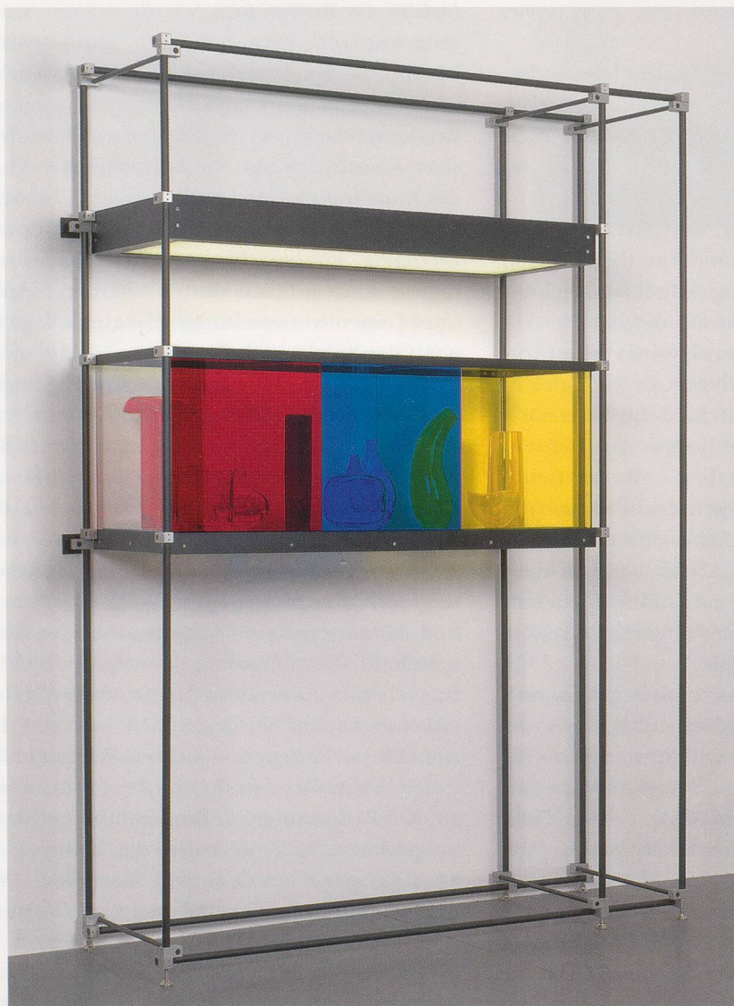
JOSIAH McELHENNY, CHROMATIC MODERNISM (RED, BLUE, YELLOW), 2008, hand-blown glass, colored laminated sheet glass, low-iron sheet glass, anodized aluminum, lighting, 86 3/8 x 61 7/8 x 19 1/4" / CHROMATISCHER MODERNISMUS (ROT, BLAU, GELB), mundgeblasenes Glas, farbige laminierte Glasscheibe, eloxiertes Aluminium, Beleuchtung, 219,4 x 155,8 x 48,9 cm.

ferenz abzugewinnen (denn das Kind erlebt dieselbe Gutenachtgeschichte jedes Mal neu), sondern auch um sich aus dieser Differenz eine alternative Welt zu schaffen. Jeder Widerstandsversuch gegen die «objektivierten Codes und materialisierten Grammatiken, die ... uns restlos umgeben wie Fruchtwasser», schreibt Virno, «reaktiviert die Kindheit. Das heisst, der zähflüssige Zustand der «sprachlichen Umwelt» löst sich auf und in der Sprache wird das wiederentdeckt, was die «Welt» versetzt und schafft. ... [D]ie Kindheit lebt fort in jener hypothetischen Sprache, die Möglichkeiten jenseits des Status zum Vorschein bringt.» 17)