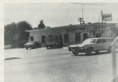
ECON - O - WASH 14 TH AND HIGHLAND NATIONAL CITY CALIF.