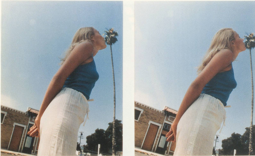
JOHN BALDESSARI, KISSING SERIES: SIMONE. PALM TREES (NEAR), 1975, color photographs, 10 x 8" each / KUSS-SERIE: SIMONE. PALMEN (NAH), Farbphotographien, je 25,4 x 20,3 cm.

IDENTITY HIDDEN WITH VARIOUS HATS (Portrait: Künstleridentität verborgen hinter mehreren Hüten) bereits 1974 Hüte vors Gesicht gehalten, um dennoch ein authentisches Selbstbildnis zu liefern, weil es jenseits blosser Dokumentation der Physiognomie ein Porträt seiner Arbeitsweise liefert. Dass weniger mehr sein kann, konnte gerade im Umfeld Hollywoods mit seinem überbordenden Kult glamouröser Gesichter kaum prägnanter und widerständiger formuliert werden.