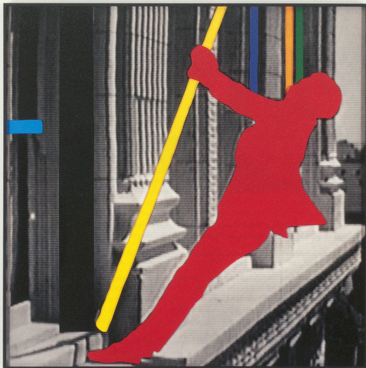
JOHN BALDESSARI, THE DURESS SERIES: PERSON HOLDING ONTO POLE ATTACHED TO EXTERIOR OF TALL BUILDING, 2003, digital photographic print, acrylic on Sintra, 60 x 60" / DIE NOT-SERIE: PERSON SICH AN EINEM HOHEN GEBÄUDE AN EINER STANGE HALTEND, digitaler photographischer Print, Acryl auf Sintra, 152,4 x 152,4 cm.