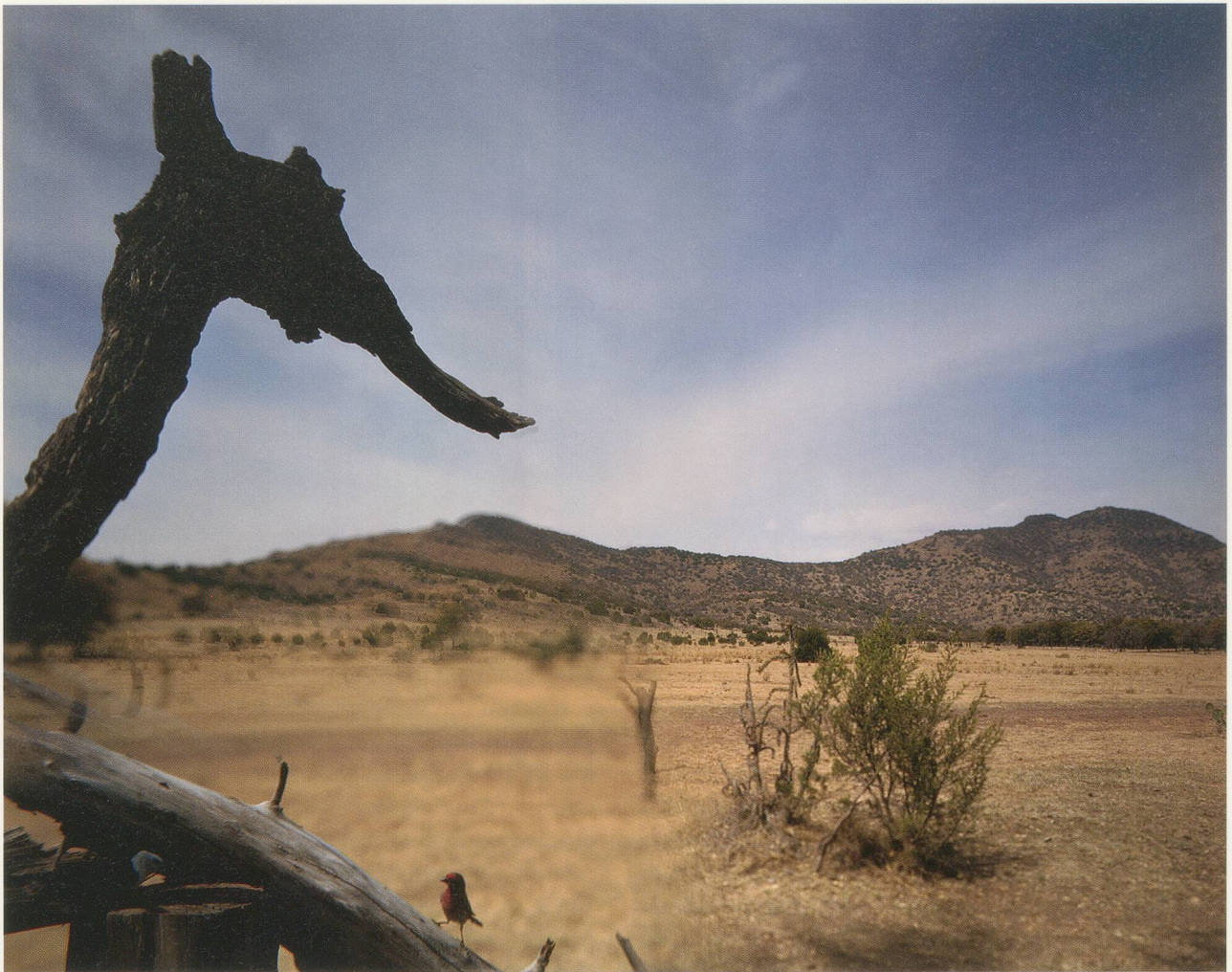
JEAN-LUC MYLAYNE, NO. 366, FÉVRIER MARS 2006, 123 x 153 cm / 48 1/2 x 60 1/4".

lung des der Kamera inhärenten Bildausschnitts mittels Öffnungen, Winkeln und Durchblicken zwischen Latten oder Lamellen hindurch, wie man sie auf Bauernhöfen findet. Bei NO. 4 rahmt eine grob geschnittene Fensteröffnung in einer Scheunenwand den taumelnden Flug einer Schwalbe ein, während im Hintergrund leeres Gelände, gewisste Mauern und schräge rote Ziegeldächer ins Blickfeld rücken. Das Bild NO. 5, JUIN JUILLET AOÛT 1979, wiederum verlegt den ländlichen Durchblick in den linken unteren Bildbereich, da der Vogel unmittelbar vor dem Aufleuchten des Kamerablitzlichtes ins Dachgesims