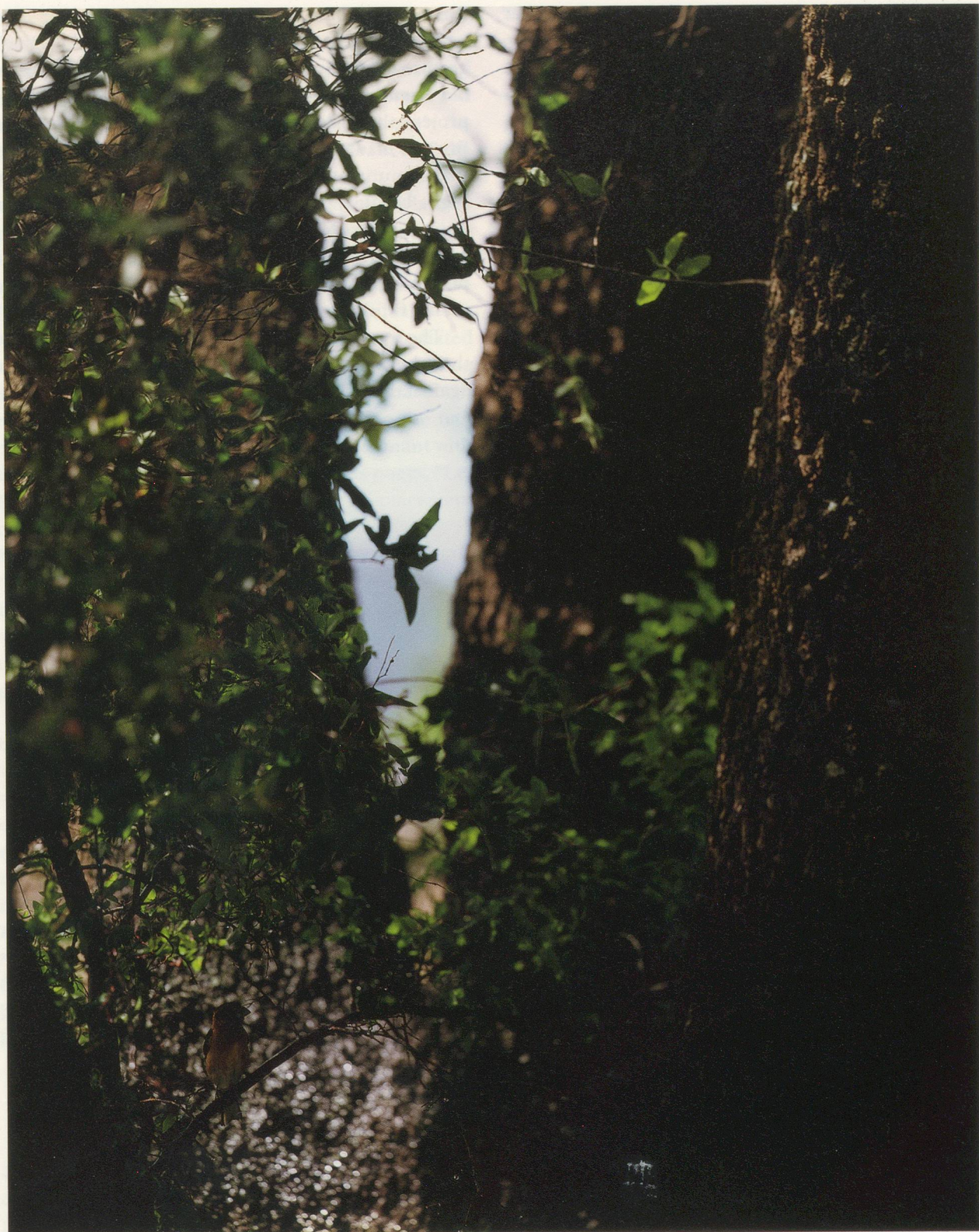
JEAN-LUC MYLAYNE, NO. 381, AVRIL MAI 2006, 228 x 183 cm / 89 3/4 x 72".