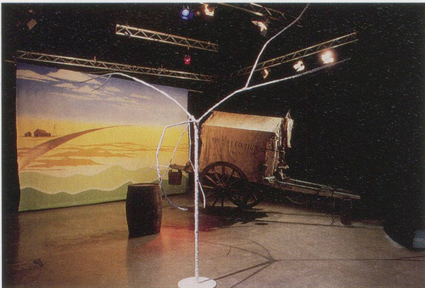
GERARD BYRNE, IN REPERTORY , 2004, multi-phase installation, including scenographic structures and video projection / IM REPERTOIRE , mehrteilige Installation, einschliesslich szenischer Elemente und Videoprojektion.

offenen Ehe gesprochen wurde. Dieses rekonstruierte Gespräch wurde mit zwölf Schauspielern in Byrnes Heimat Irland nachgestellt (wo, nebenbei bemerkt, das Magazin bis Ende der 90er Jahre verboten war); Drehort war ein nicht alltägliches spätmodernes Haus im idyllischen ländlichen Umland von Dublin, das 1972 für einen prominenten Kunstmäzen gebaut worden war. Während der Akzent der verschiedenen Schauspieler (zumindest für das Gehör eines Iren) unruhig über den Atlantik hin und her driftet, wird die Ernsthaftigkeit einer vergangenen Ära durch ein