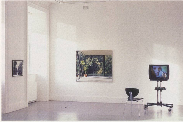
GERARD BYRNE, NEW SEXUAL LIFESTYLES , 2003, 3-channel video installation with 7 photographs, photograph and installation view at the Irish Museum of Modern Art / 3-Kanal-Videoinstallation mit 7 Photographien, Photographie und Installationsansicht.

which provides an incidental comment on the ongoing critical tussle for Beckett's legacy between celebrants of international literary modernism and the proponents of national or otherwise devolved literary canons newly revised in the light of post-colonial theory. This negotiation between the local and the global, as well as between different media, is also evident in IN REPERTORY (2004) commissioned by Dublin's Project Arts Centre, an institution which has a long history of accommodating both performing and visual arts within the same building. Ignoring the Project's purpose-built, black-box theater space, Byrne chose instead to paint the adjacent white-cube gallery space black and fit it out with stage lighting. Ranged around this displaced theater set were a number of reconstructed props and elements of stage design gleaned from the history of classic theater productions. These included a handmade version of a tree originally designed by Alberto Giacometti for a 1961 production of Waiting for Godot at the Odéon in Paris, a painted backdrop from a 1943 Broadway production of Rodgers & Hammerstein's Oklahoma! , and the ramshackle covered wagon from a 1963 Broadway production of Bertolt Brecht's Mother Courage . Gallery visitors were invited to move around the starkly lit stage set, from which they