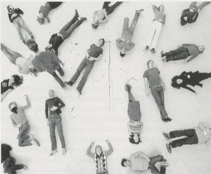
JOHANNA BILLING, MISSING OUT, 2001, video loop, 3 min. 10 sec. / AUSGESETZT, Videoloop, 3 Min. 10 Sek.

übergeordnetes Ganzes eingebunden. Die kollektive Übereinstimmung im stillschweigenden Konsens basiert letztlich auf der Willenlosigkeit der Subjekte, die wie durch Geisterhand gesteuert, Entscheidungen und Prozesse herbeiführen. So herrscht auch in ritualisierten Praktiken wie dem Gruppenexperiment MISSING OUT (Ausgesetzt, 2001) eine Stimmung forciert Harmonie, die das Ausscheren zum Verrat stilisiert. In den 70er Jahren wurde in den schwedischen Primarschulen und Kindergärten eine