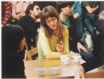
JOHANNA BILLING, PROJECT FOR A REVOLUTION , 2000, video loop, 3 min. 10 sec. / REVOLUTIONSPROJEKT , Videoloop, 3 Min. 10 Sek.

sions are ultimately based on the pressures of society and how this relationship must always be seen in dialectical terms. Thus, for a brief moment, the perspective switches from the registering, observing gaze of the diver to her subjective view. Allegorically, the scene evokes the conventional topoi of high-performance athletics. Alone and undaunted, artists at the edge of the abyss brave the harsh gaze of criticism high above the heads of all others.