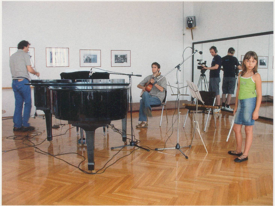
JOHANNA BILLING, MAGICAL WORLD , 2005, video loop, 3 min., 10 sec. / MAGISCHE WELT , Videoloop, 3 Min. 10 Sek.

sense of social belonging. The protagonists in Billing's video all belong to the same generation, wear similar clothes, and probably like the same bands. Moreover, music is a sign of the history, ideals, and locale that mark her own artistic activities within a specific cultural, economic, and social context.