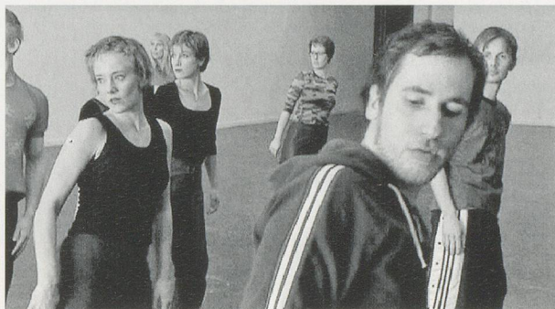
JOHANNA BILLING, GRADUATE SHOW, 1999, video, 3 min. 15 sec. /

In MAGICAL WORLD (Magische Welt, 2005) der jüngsten, auf der Istanbul Biennale gezeigten Arbeit, hat Johanna Billing kroatische Kinder in einem Kulturzentrum ausserhalb Zagrebs den berührenden Song «Magical World» des schwarzen amerikanischen Sängers Sidney Barnes von Rotary Connection singen lassen. Der Songtext spricht mit Stolz und Melancholie von persönlichen Veränderungen. Von Veränderungen, wie sie auch in diesem relativ jungen Land, das sich der Europäischen Union