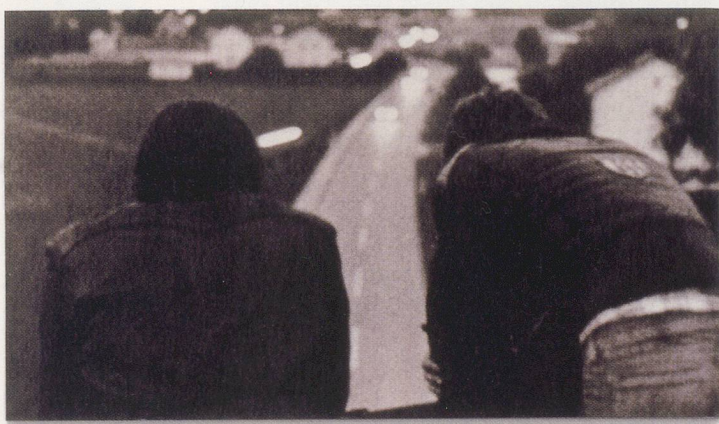
KAI ALTHOFF, UNTITLED (from IMMO ), 2004, photograph mounted on wood fibre, 15 3 / 4 x 27 1 / 2 " / OHNE TITEL (aus IMMO ), Photographie auf Pressspan aufgezogen, 40 x 70 cm.

cloth (veils), and other smaller objects—seem to be lying, hanging and leaning, but not standing. They show a precarious poise between yesteryear's perfumed world of beautiful appearances, exemplified by fashion photographs of smart beaux, and pensive, occasionally religiously inclined groups of young people. The latter is the painted (created) world of spirituality, trance, and renunciation, that stands against the arrangements on a platform, that might be described as the "readymade zone"—one of artificiality and worldliness, whose tulle, boas, shawls, its silk scarves and dresses are invested with a wintry luminosity all their own. Also stationed there are a small baby carriage and a grandfather clock that might be seen as aspects and allegories of life—and of life's transience. Three women illuminated by lamps rise eerily out of this iridescent, decadent world—mannequins draped in fabric that give the appearance of living caryatids. Two are in white and pink, and one (comprised of two kissing specters) is in black. These female towers evoke Gustav Klimt's lost so-called "faculty paintings" at the University of Vienna—female allegories represented only by faces looming out of a convoluted array of abstract, whirling and flowing lines. Could these beacons rising