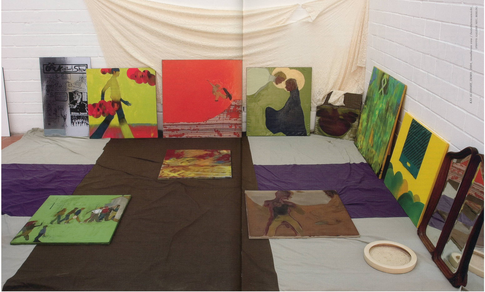
К.А. АЛЕКСЕЕВ, ДАМО, 2004, инсталляция из / Installation with / ПРОТЯЖЕНИЕ ВРЕМЕНИ / EXTENSION OF TIME / ПРОТЯЖЕНИЕ ВРЕМЕНИ / EXTENSION OF TIME