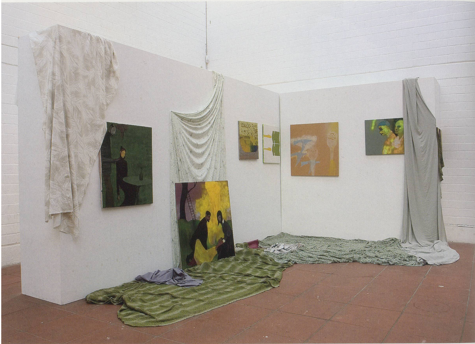
KAI ALTHOFF, IMMO , 2004, installation view / Installationsansicht.