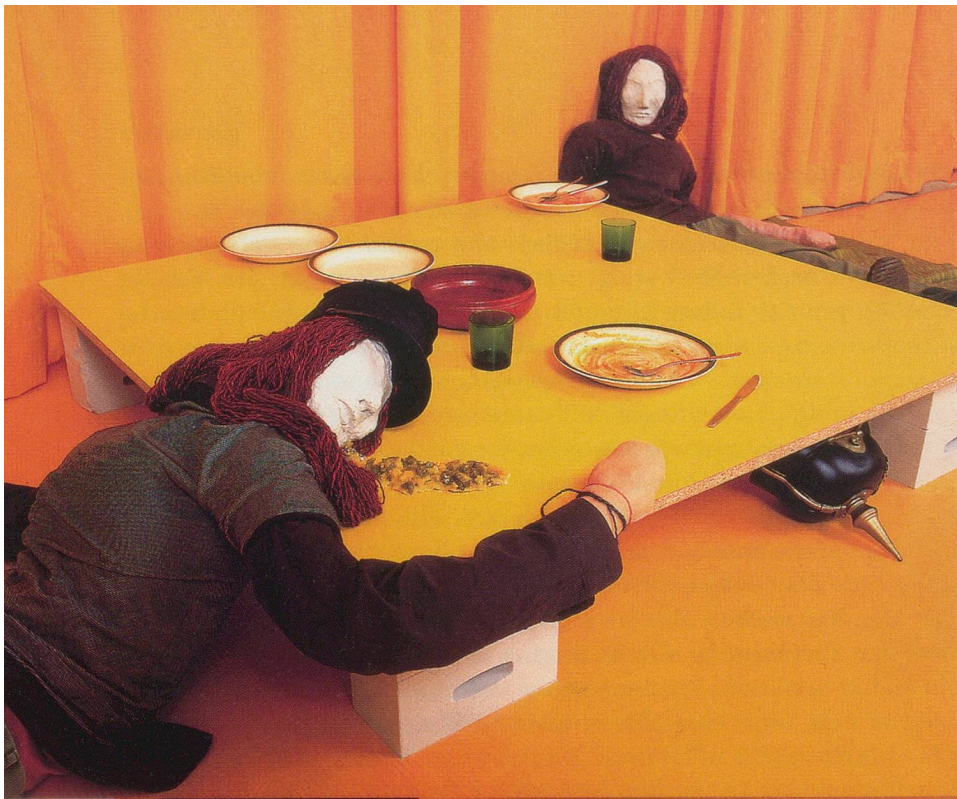
KAI ALTHOFF, REFLEX LUX, 1998, installation view, Galerie Neu / Installationsansicht.