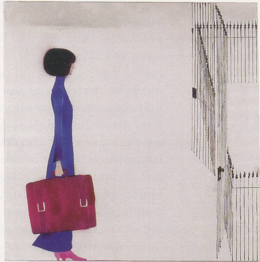
KAI ALTHOFF, UNTITLED (from IMMO), 2004, ink on silk, 36 1/4 x 28 3/4" / OHNE TITEL (aus IMMO), Tusche auf Seide, 96,5 x 94,5 cm.