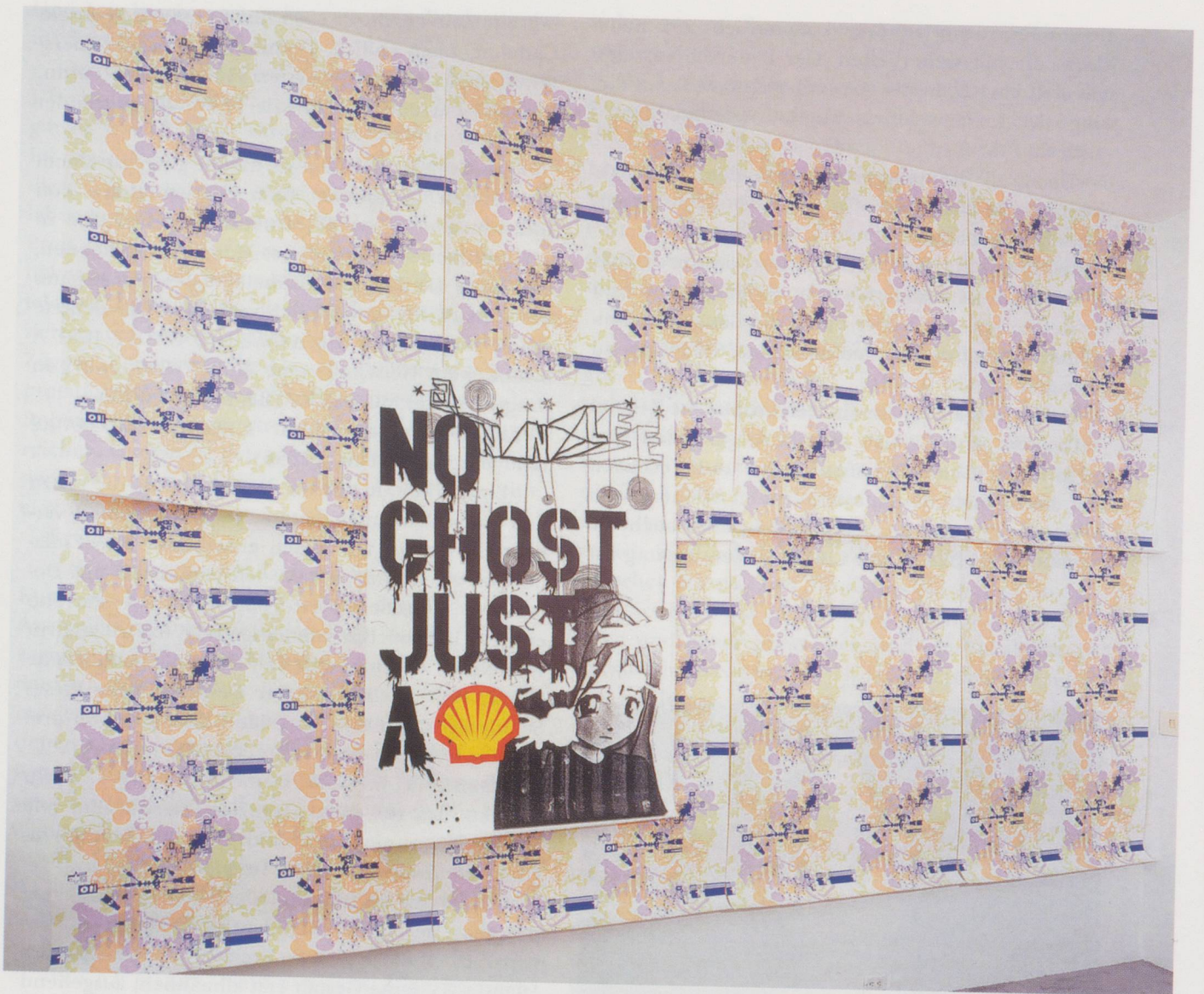
PIERRE HUYGHE, WALLPAPER POSTER 1.3 (Annlee Colors) and NO GHOST JUST A SHELL, silkscreened poster, M/M, Paris, 2000–2001 / TAPETEN-POSTER 1.3 (Annlee-Farben) und NO GHOST JUST A SHELL, Siebdruckplakat.

(COPYRIGHT: MARIAN GOODMAN GALLERY, PARIS & NEW YORK)