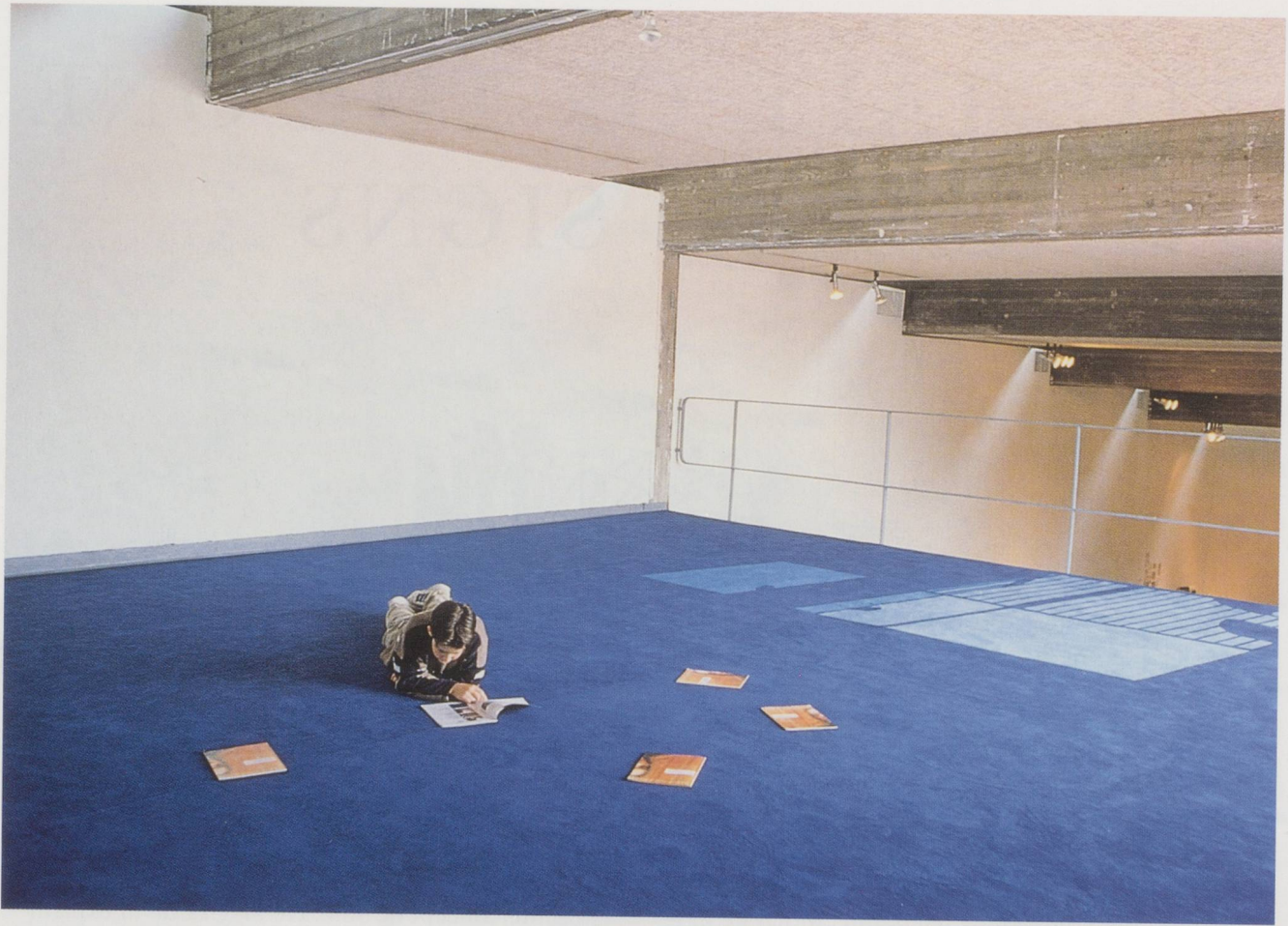
PIERRE HUYGHE & PHILIPPE PARRENO, 06.00 PM, 2001, carpet, exhibition view, Stedelijk Van Abbemuseum, Eindhoven / Teppich.