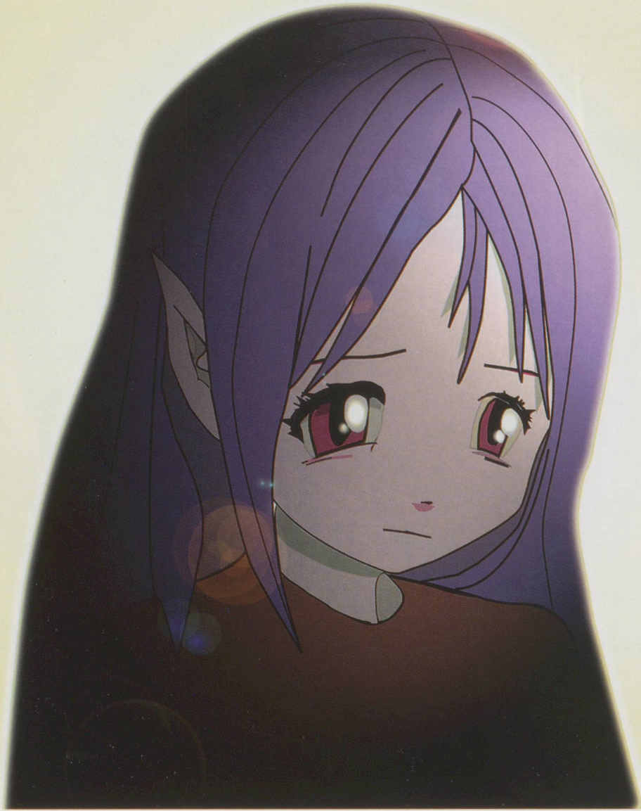
PIERRE HUYGHE & PHILIPPE PARRENO, NO GHOST JUST A SHELL, ANNLEE, collaboration project, 1999, original image of Annlee / Originalfigur.