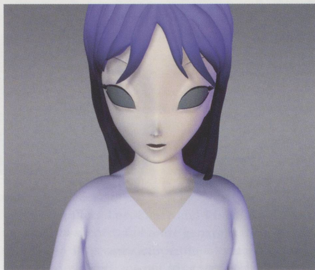
PIERRE HUYGHE, TWO MINUTES OUT OF TIME , 2000,

Danach zählte Pierre all die vergangenen und zukünftigen Gemeinschaftsprojekte und Vorhaben auf, die er mit Luc hätte diskutieren können, «um weiterzukommen». Annlee natürlich, aber auch die ASSOCIATION DES TEMPS LIBÉRÉS (Vereinigung für