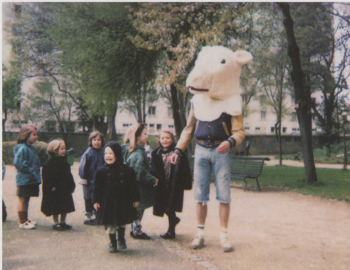
PIERRE HUYGHE, LA TOISON D'OR / THE GOLDEN FLEECE, 1993, event and leaflet / DAS GOLDENE VLIES, Aktion und Flugblatt. (COPYRIGHT: MARIAN GOODMAN GALLERY, PARIS & NEW YORK)

(Translated from the French by Anthony Allen)